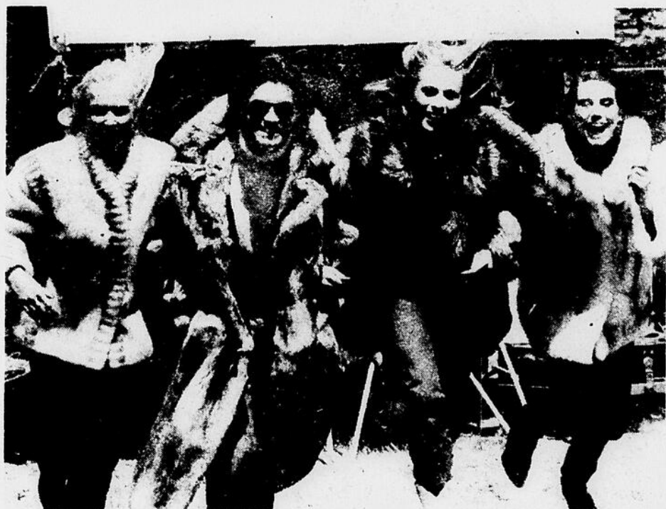
De gauche à droite: veste de vison Canada Majestic violet, marmotte, veste et écharpe de renard argenté, veste de renard bleu.