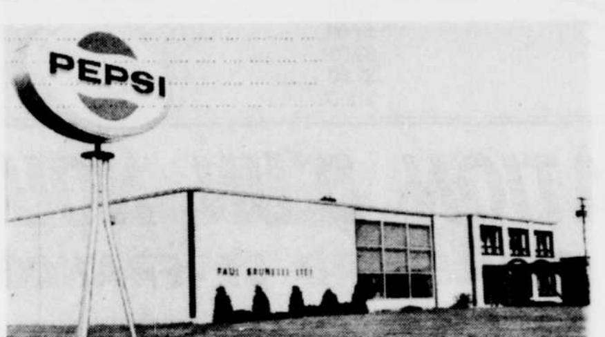
GRÈVE CHEZ PEPSI-VICTORIAVILLE — Le calme régnait hier autour de l'usine d'em-bouteillage Pepsi Cola, sur la rue St-François, à Victoriaville, où une vingtaine d'employés ont déclenché l'arrêt de travail.