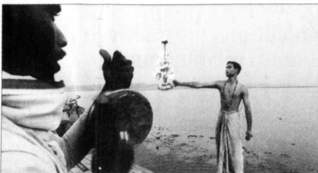
Des prêtres hindous lors d'une cérémonie au dieu Sangam, au confluent du Gange, du Yamuna et du mythique Saraswati, à Allahabad en Inde... là où les cendres d'Harrison devraient être dispersées.