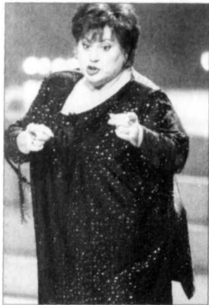
Ginette Reno chante Noël à l'émission de Patrice L'Écuyer

■ Vous n'avez aucune idée de ce que vous achèterez à votre enfant, votre neveu, votre nièce pour Noël? L'équipe des 400 coûts a pensé à vous et vous propose une foule d'idées cadeaux. Optez-vous pour un jouet québécois? On vous en montre une panoplie. Ou pour une console de jeux, parmi la Xbox de Microsoft, la GameCube de Nintendo et la PlayStation 2 de Sony? On les teste pour vous. À moins que vous ne préfériez un nouveau jeu de société? Vous avez le choix. Les 400 coûts, Télé-Québec à 20 h.