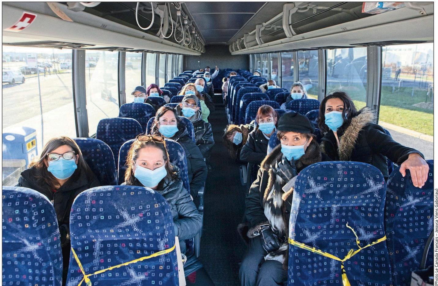
La Caravane de l'emploi était organisée par le Quartier de l'emploi.