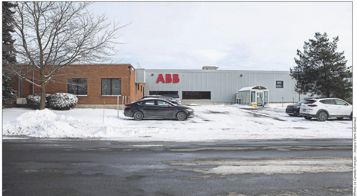
Les 350 employés syndiqués de l'usine ABB de la rue Longtin à Saint-Jean-sur-Richelieu obtiennent des augmentations salariales de 15 % sur quatre ans.