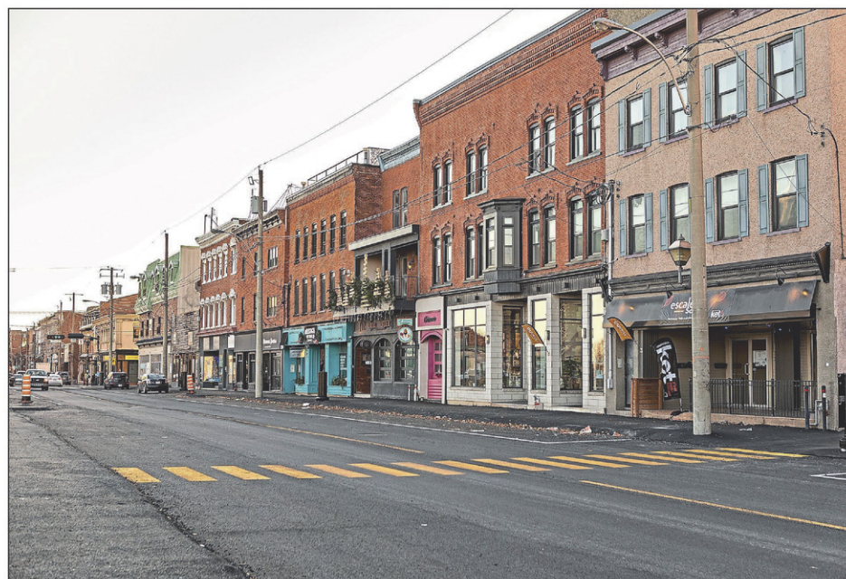
Une vingtaine de commerçants ont bénéficié du programme d'appui aux entreprises commerciales du Vieux-Saint-Jean.

Les commerçants avaient jusqu'au 20 novembre pour déposer une demande avec des pièces justificatives. Plus tôt cet automne, la Ville avait remis 16 300 $ à quelques-uns d'entre eux. Pattes et Griffes,