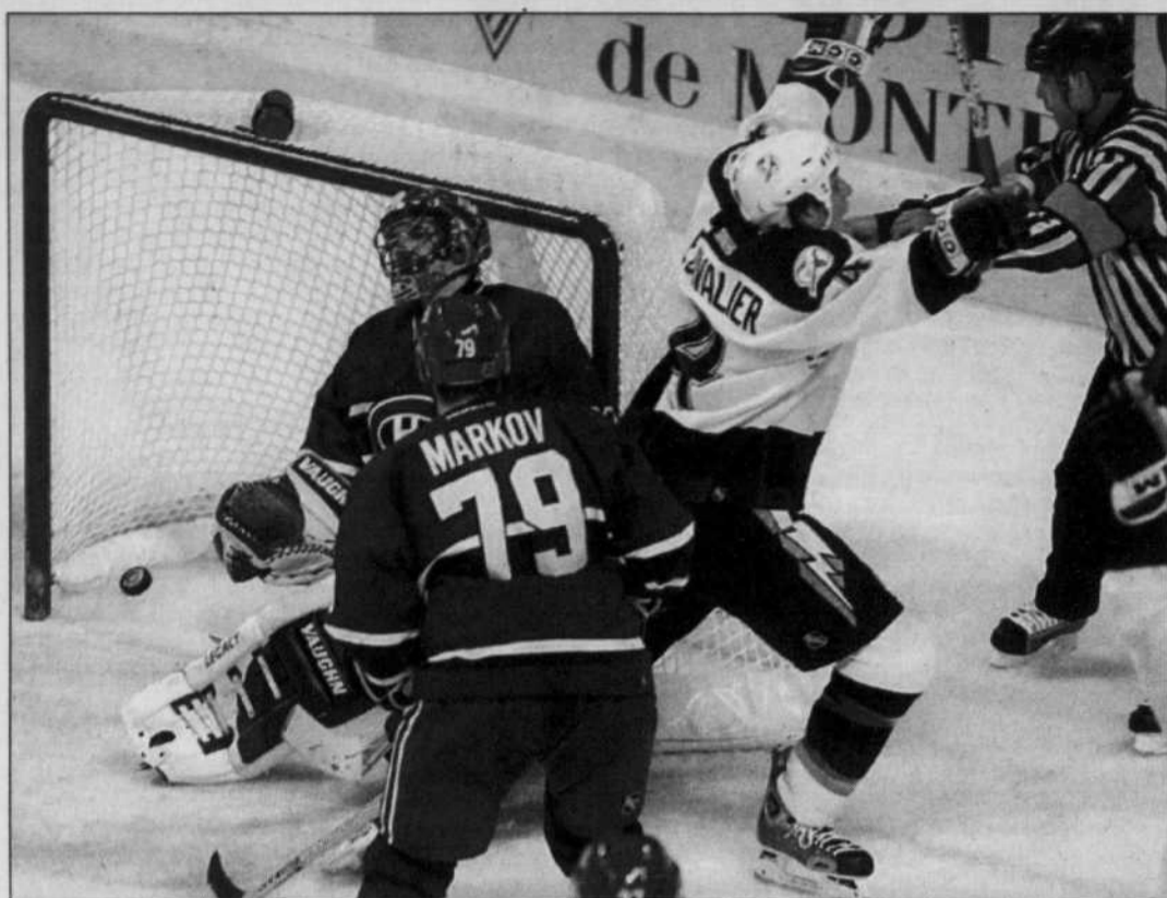
Vincent Lecavalier a marqué à sept secondes de la fin du match, lundi, forçant une prolongation que le Lightning a gagnée.