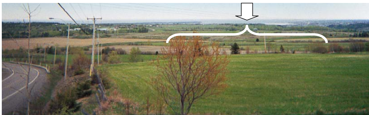
Figure 6 : Vue panoramique à partir du haut de la montée de la route du Bel-Air

Modifiée de l'étude d'impact sur l'environnement, juillet 2002.