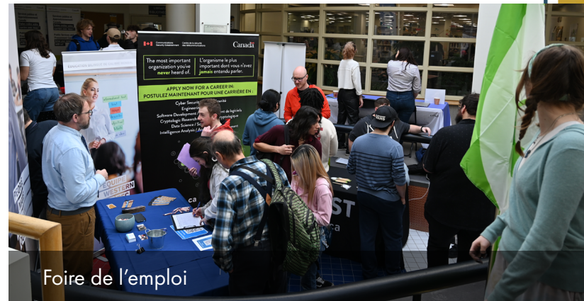
Foire de l'emploi

Cet événement annuel s'est tenu le 14 février 2024 et a permis aux entreprises et institutions locales de fournir des informations sur leurs organisations à la population étudiante et comme moyen de recrutement.