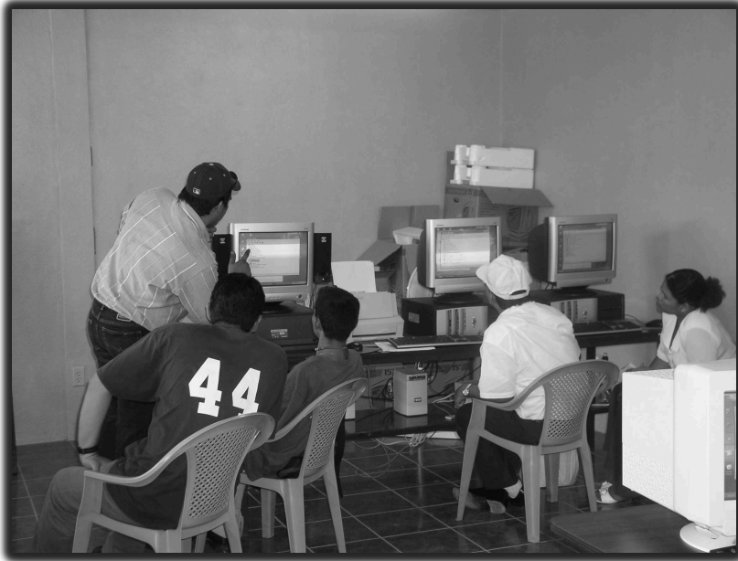
Curso de Computación en el Centro de Internet