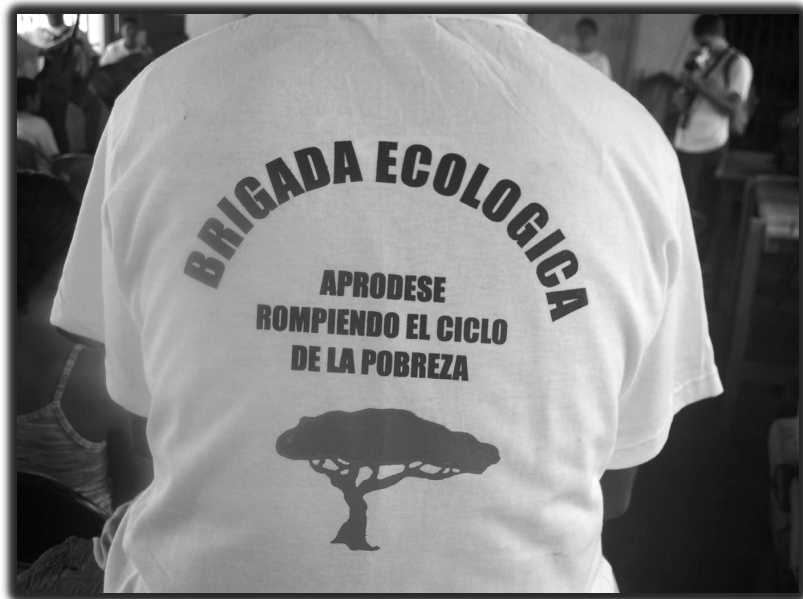
Sigue la Revolución

Después paso al Estado a trabajar como empleado estatal dentro de las filas. Me integro después a una cooperativa agropecuaria en el municipio de Villanueva trabajando con UNAG, y las milicias y educación de adultos hemos participado en diferentes tareas siempre en lucha por los demás, sobre todo por los más pobres y seguiremos con esa conciencia revolucionaria