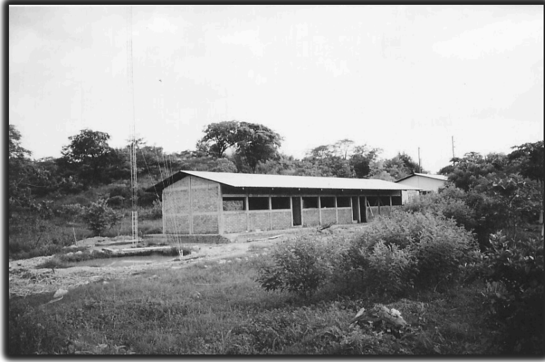
Centro de Internet de APRODESE