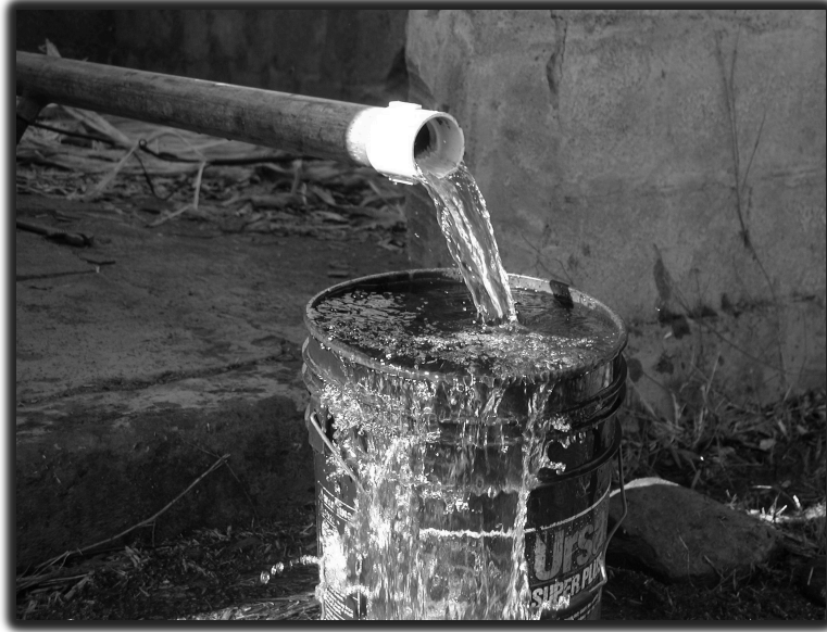
Agua potable – Proyecto de APRODESE