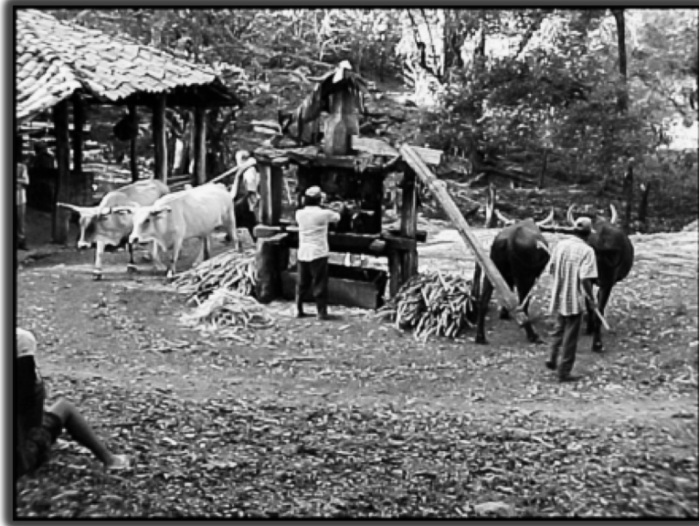
La molienda de caña en el trapiche de la Caldera