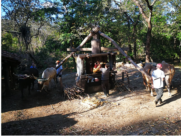
El trapiche en la Caldera