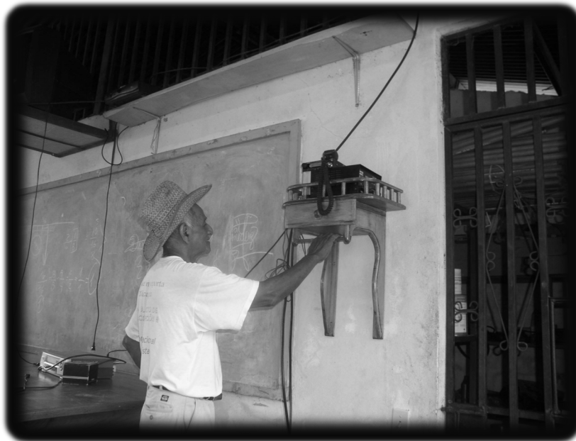
El papá, frente a la radio en el Centro de Capacitación