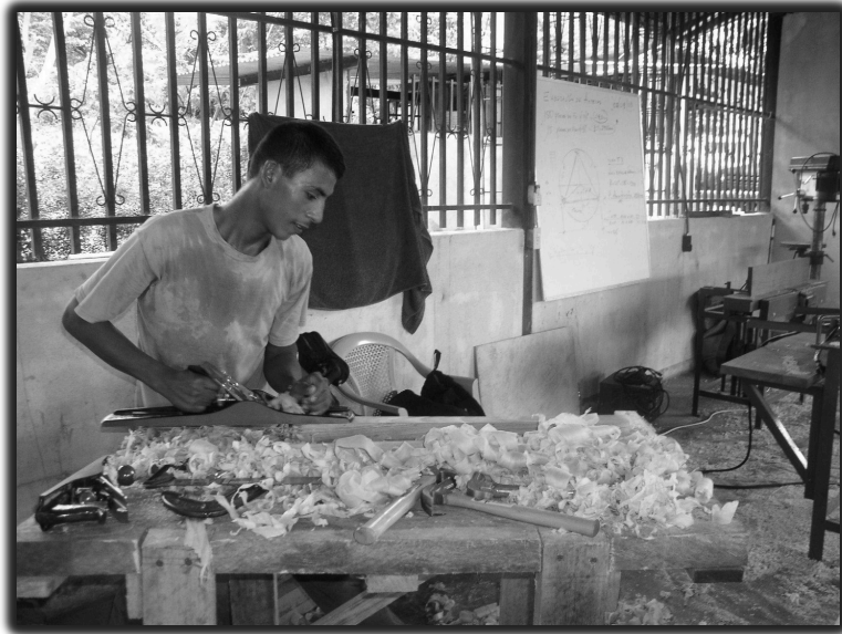
Curso de ebanistería - Centro de Capacitación de APRODESE