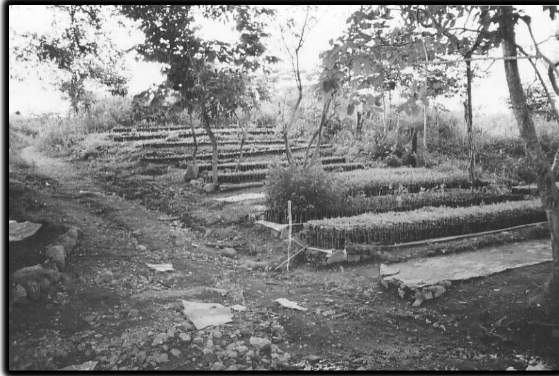
Reforestación - proyecto de Asociación para el Desarrollo Socioeconómico del Espino (APRODESE)

Actualmente estoy de gerente en el municipio del Viejo cumpliendo 32 años de estar trabajando.