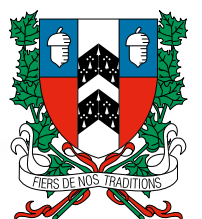
Ludovic Grisé Farand, maire