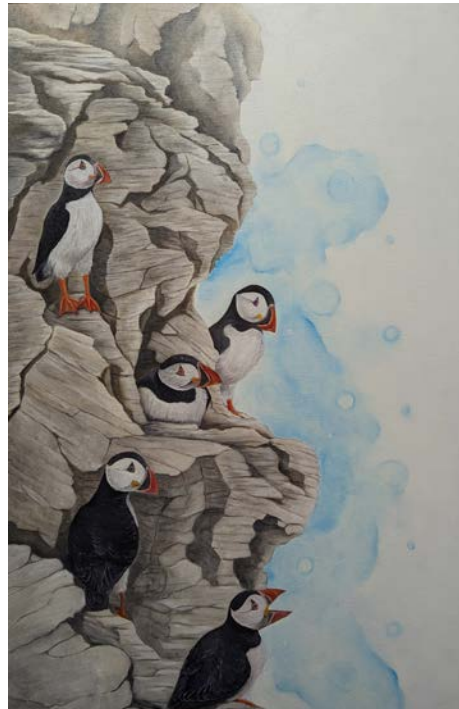
L'exposition prend fin le 29 novembre prochain.

Elle arrive par ailleurs à des rendus qui la surprennent elle-même après avoir peaufiné sa technique depuis plus d'une quinzaine d'années. Le fond de l'une des toiles exposées à la bibliothèque de Sainte-Julie est une très grande réussite pour l'artiste. Un manchot empereur est superposé à un fond bleu avec un effet aquarelle. « Je voulais un fond neutre épuré. J'ai donc donné un effet aquarelle avec ma peinture à l'huile. C'était