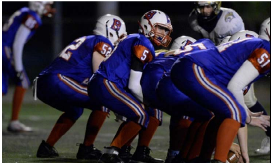
Les Barons ont connu du succès en 2024.

Packers de la finale auront réussi à les vaincre en saison.