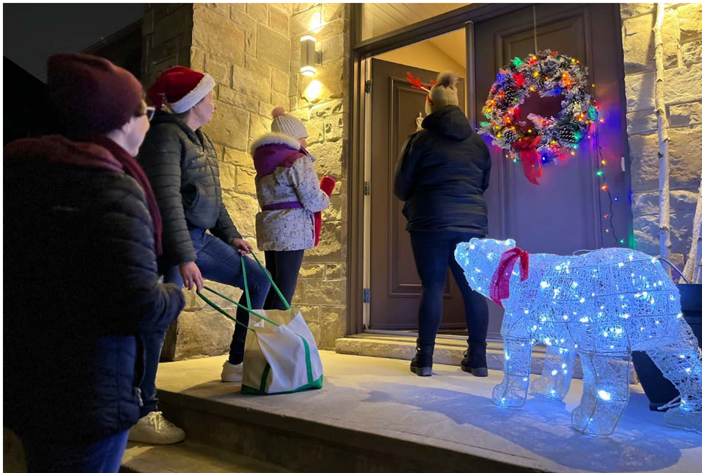
À Saint-Bruno, les guignoleux passent de porte à porte pour recueillir des dons.

« La guignolée, c'est une belle façon de retomber en amour avec le bénévo-