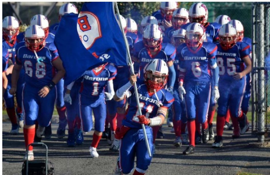
Le homecoming des Barons se déroule au parc Rabastalière, à Saint-Bruno.

En saison régulière, les Barons peewee ont marqué 195 points, n'en accordant que 82 à l'adversaire. Ils ont gagné tous leurs duels à l'extérieur. Seuls les fameux