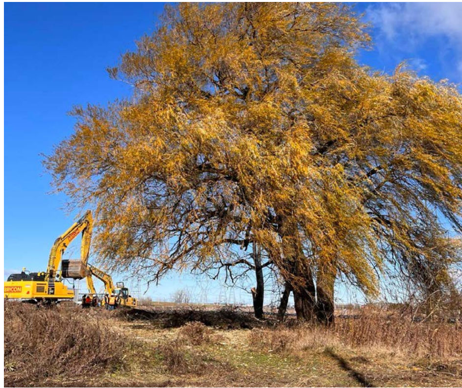
Des travaux sont amorcés autour de l'arbre.

Rappelons que Saint-Bruno est reconue, entre autres, pour la qualité de son environnement, notamment ses arbres.