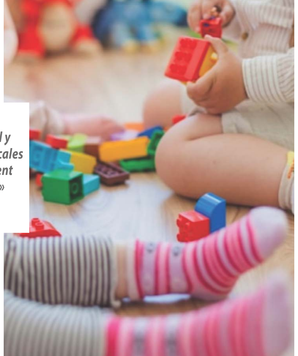
Des éducatrices des centres de la petite enfance affiliés à la CSN ont voté un mandat de grève de cinq jours.

« C'a bien été reçu par les parents, qui sont très solidaires à notre cause », mentionne-t-elle, peu optimiste que le conflit se règle avant les Fêtes. « Ce serait un monde de licornes, mais c'est toujours notre désir de signer une entente avant Noël », commente-t-elle, précisant que quelques journées de négociations ont été ajoutées par le gouvernement.