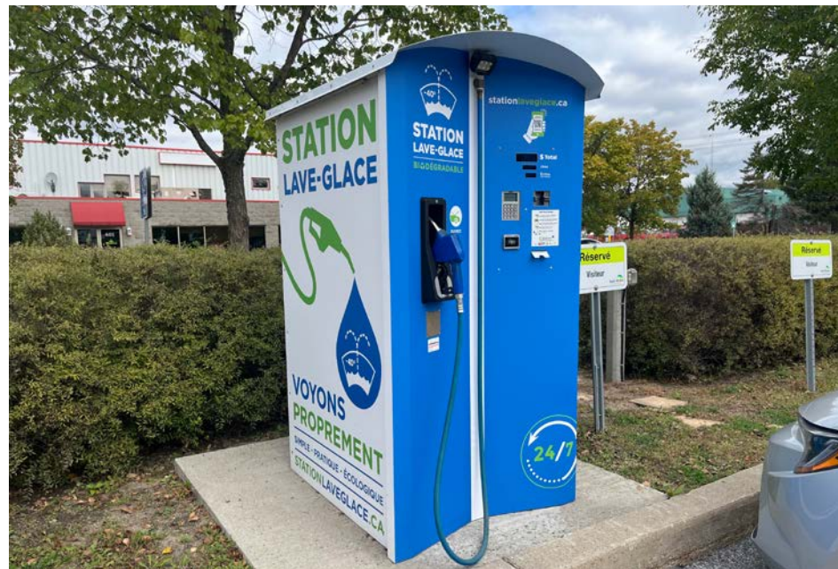
La station de lave-glace libre-service est située à l'écocentre de Saint-Bruno-de-Montarville

Les sacs de plastique sont interdits sur le territoire de Saint-Bruno depuis 2017. Depuis peu, l'agglomération de Longueuil a interdit aussi ces mêmes sacs pour la collecte des feuilles et des branches.