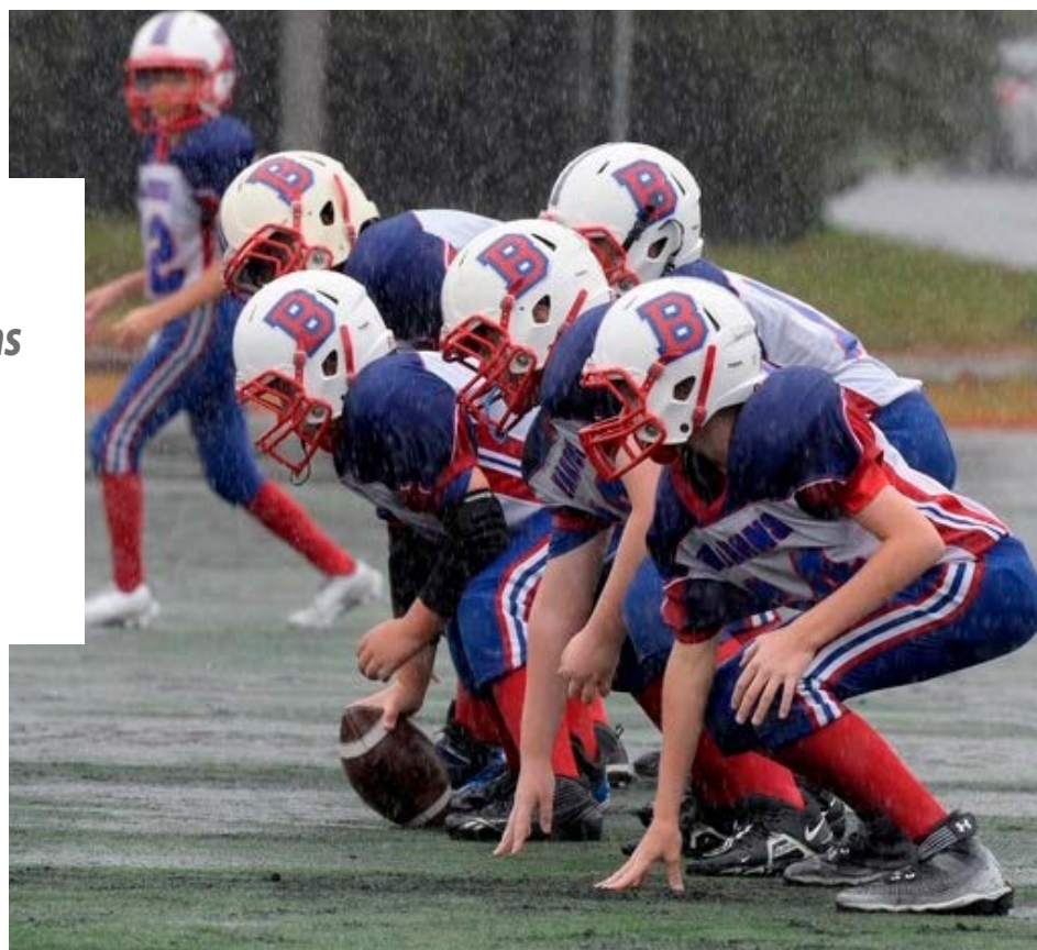
Le football se joue aussi sous la pluie!