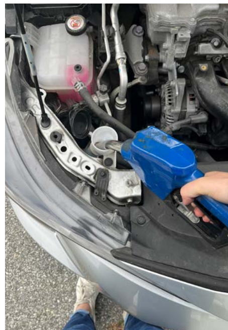
Le litre de lave-glace coûte environ 1,20 $ à Saint-Bruno.

M. Grisé Farand mentionne toutefois que d'autres actions pourront voir le jour après la compilation des consultations concernant le plan climat. L'adoption de ce plan devrait se faire en 2025, selon le maire.