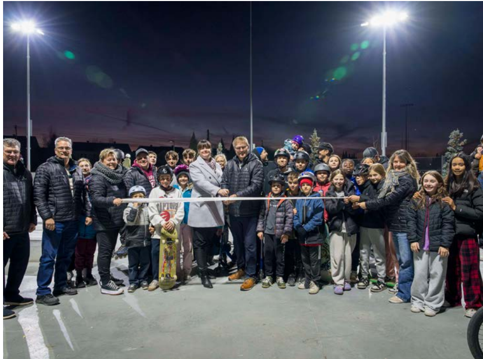
La Ville de Sainte-Julie a inauguré son tout nouveau skatepark le 15 novembre en fin d'après-midi.

L'évènement a eu lieu le vendredi 15 novembre dernier. Les jeunes déambulaient sur la rampe en trottinette, en patin à roues alignées ou en skateboard . Certains petits faisaient leur premier essai sur des trotteurs, des vélos sans pédales désignés pour aider l'enfant avec son équilibre. Plusieurs adultes assuraient le bon partage du lieu et en profitaient, par leur expérience dans le parc de planche à roulettes, pour donner des conseils aux plus jeunes.