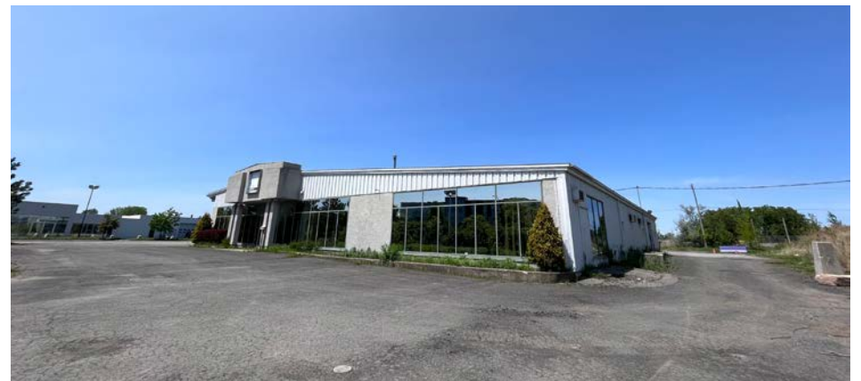
Ce site pourrait accueillir la caserne 14 de Saint-Bruno-de-Montarville.

« Le coût donné par Longueuil couvrira le coût de notre acquisition du terrain et les frais de démolition, prévue l'an prochain », se réjouit le maire.