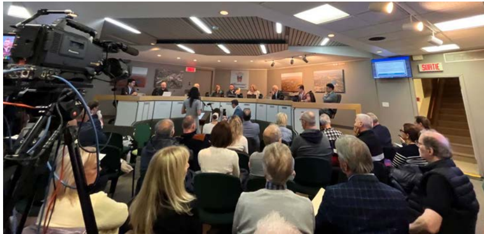
Plus de 40 personnes s'étaient déplacées mardi soir pour la séance du conseil municipal.