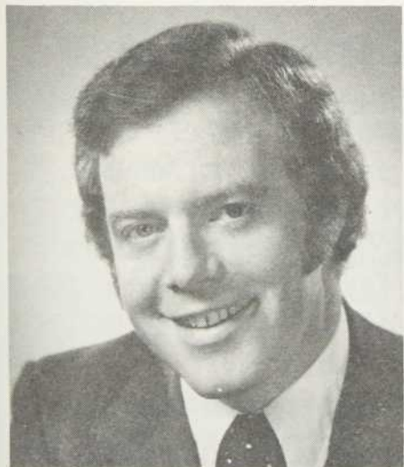
Déjeuner-causerie Le mardi 16 octobre 79 Le conférencier

Honorable Robert René de Cotret Ministre de l'Indus- trie et du Commerce et ministre d'Etat chargé de Développe- ment économique.