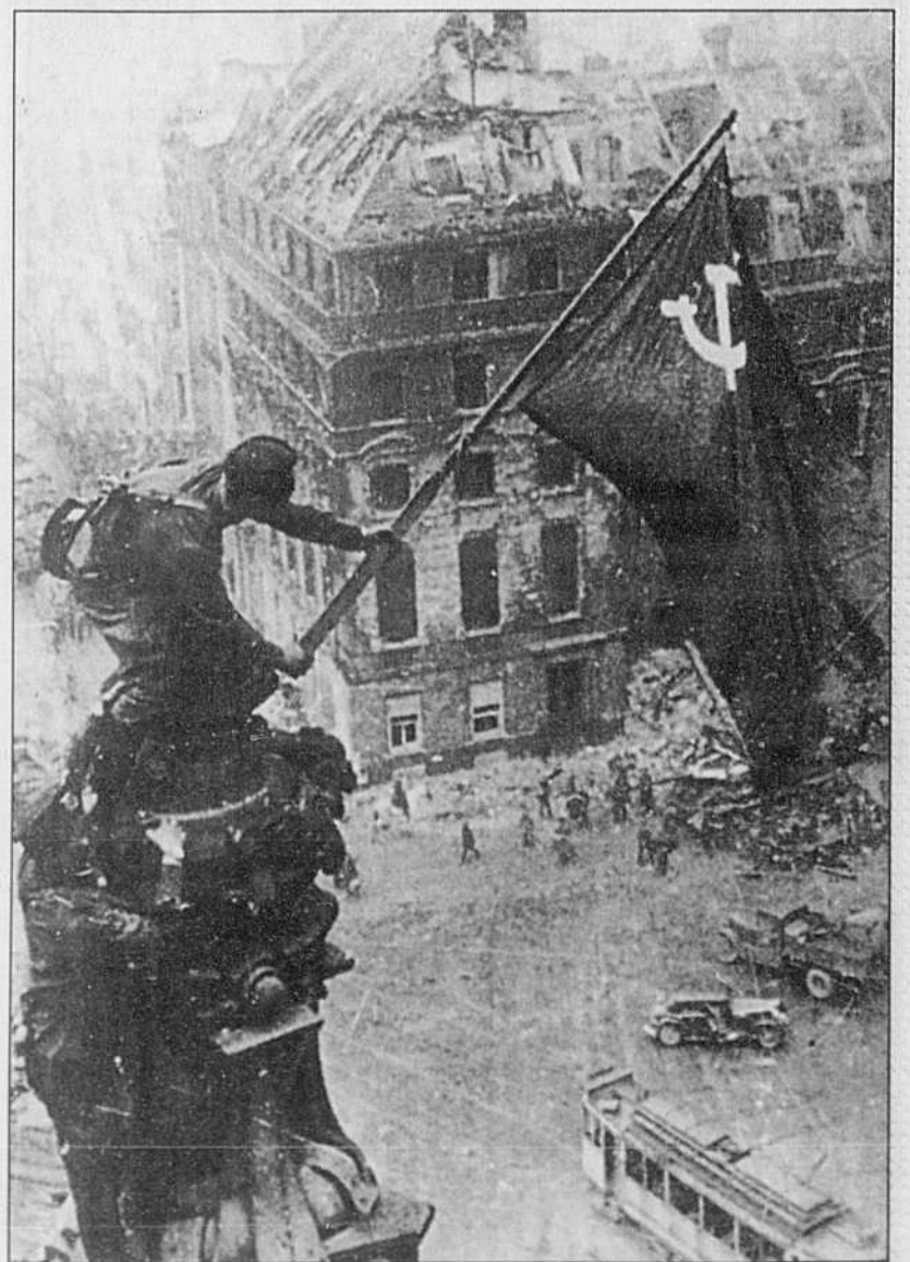
PHOTO ARCHIVES C'était il y a cinquante ans: les Soviétiques entrent dans Berlin et prennent possession du Reichstag.