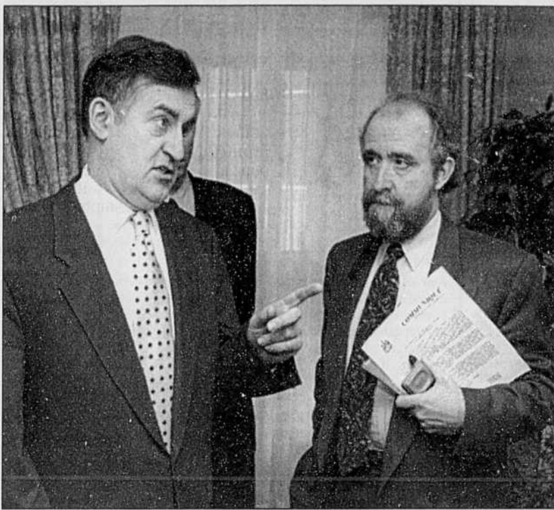
Lucien Bouchard et Gérald Larose, hier: «Ils vont frapper qui?»

Rappelant que le ministère québécois de la Sécurité du revenu a reçu presque 10 000 demandes supplémentaires de l'aide sociale en avril, M. Bouchard a déploré que ce déplacement de l'assurance-chômage vers l'aide sociale permette à Ottawa de se vanter d'un taux de chômage à la baisse. « C'est le monde à l'envers où des gains (dans la réduction du chômage se traduisent par une dété-