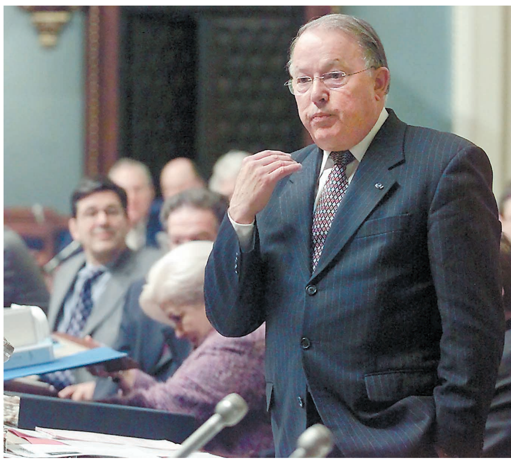
Le premier ministre Bernard Landry a également confié de nouvelles responsabilités à Richard Legendre, André Boisclair et François Legault.

Au Revenu, quelque temps avant sa démission, elle avait également été critiquée à la suite du renvoi d'une collaboratrice parce qu'elle était enceinte.