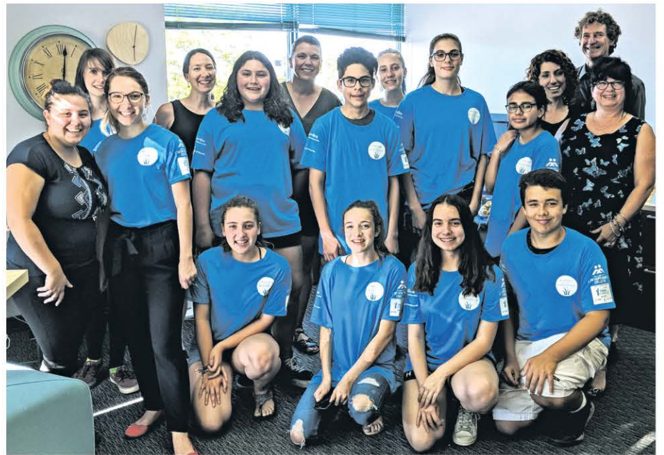
Les jeunes entrepreneurs avec les coordonnatrices et certains partenaires du projet.

Les gens peuvent obtenir toutes les informations quant aux différents services offerts par la Brigade CIEC district Boucherville via la page Facebook @brigadeCIECBoucherville; par courriel à brigadeboucherville@gmail.com ; ou par téléphone au 438 874-0767.