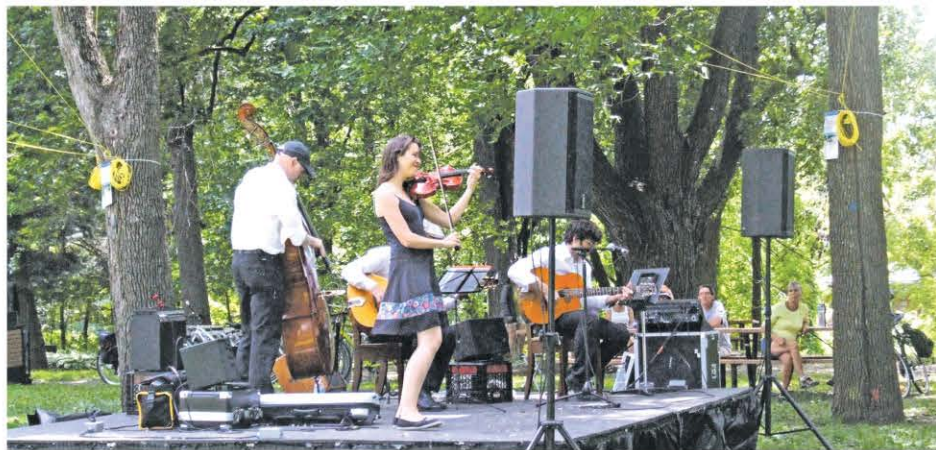
Le trio Gypsy Strings était enrichi d'une violoniste pour cette prestation au parc De La Broquerie.

teurs écoutaient attentivement et confortablement la performance de ces musiciens talentueux. Le prochain Rendez-vous champêtre Desjardins se tiendra le dimanche 22 juillet, toujours à 14 h. Cette fois, l'Ensemble Fiestango, formé de trois musiciennes spécialisées dans le tango argentin, montera sur la scène au parc de la Broquerie.