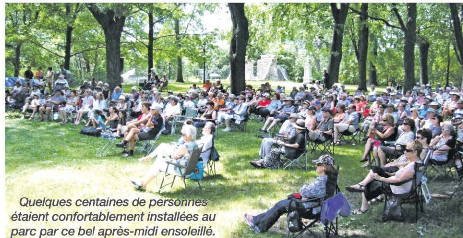
Quelques centaines de personnes étaient confortablement installées au parc par ce bel après-midi ensoleillé.