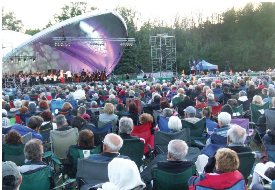
Une foule de plusieurs milliers de spectateurs était rassemblée au parc Michel-Chartrand pour ce concert extérieur.