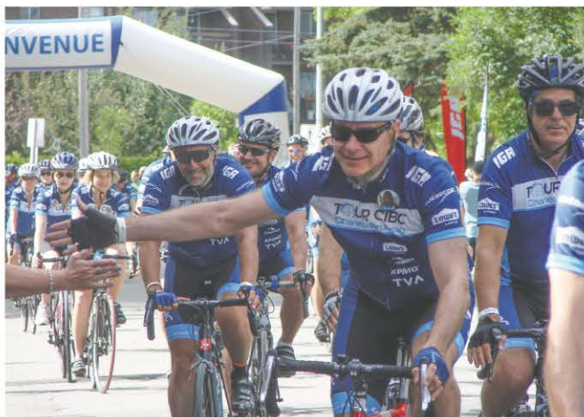
L'arrivée à Boucherville s'est déroulée dans une ambiance festive.

La Fondation Charles-Bruneau est le principal bailleur de fonds de la recherche en hématologie pédiatrique au Québec. Dans les prochaines années, 22 M$ seront investis à l'Unité de recherche en hématologie pédiatrique Charles-Bruneau du CHU Sainte-Justine, et 4 M$ seront également versés à l'Hôpital de Montréal pour enfants.