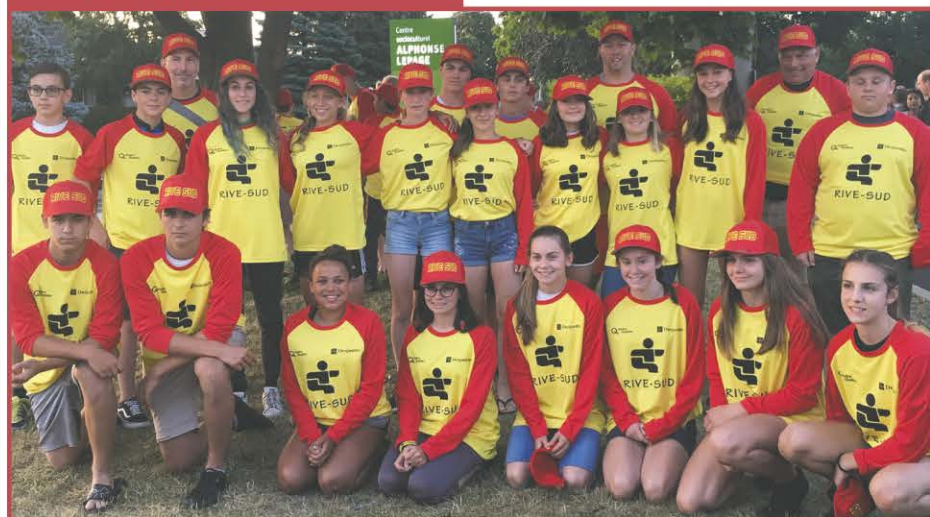
Les athlètes de Boucherville, Varennes, Sainte-Julie et Verchères.

Venez visiter notre nouvelle concession à BOUCHERVILLE !