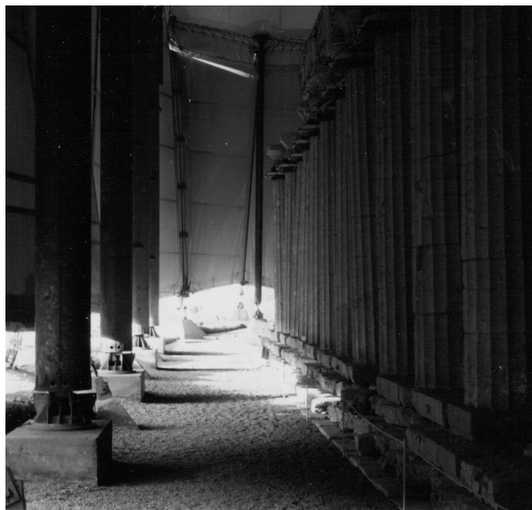
J'ai pris les photos du temple en 1995