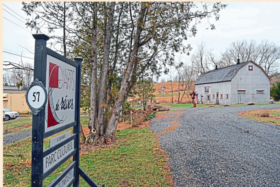
Pour la suite du monde se tient du 29 août au 1 er septembre.

Il s'agit de la deuxième édition du festival, lancé en 2024. Pour plus d'informations ou pour accéder à la programmation détaillée, les intéressés sont invités à se rendre sur le site internet de D'Arts et de rêves au dartsetdereves.org .