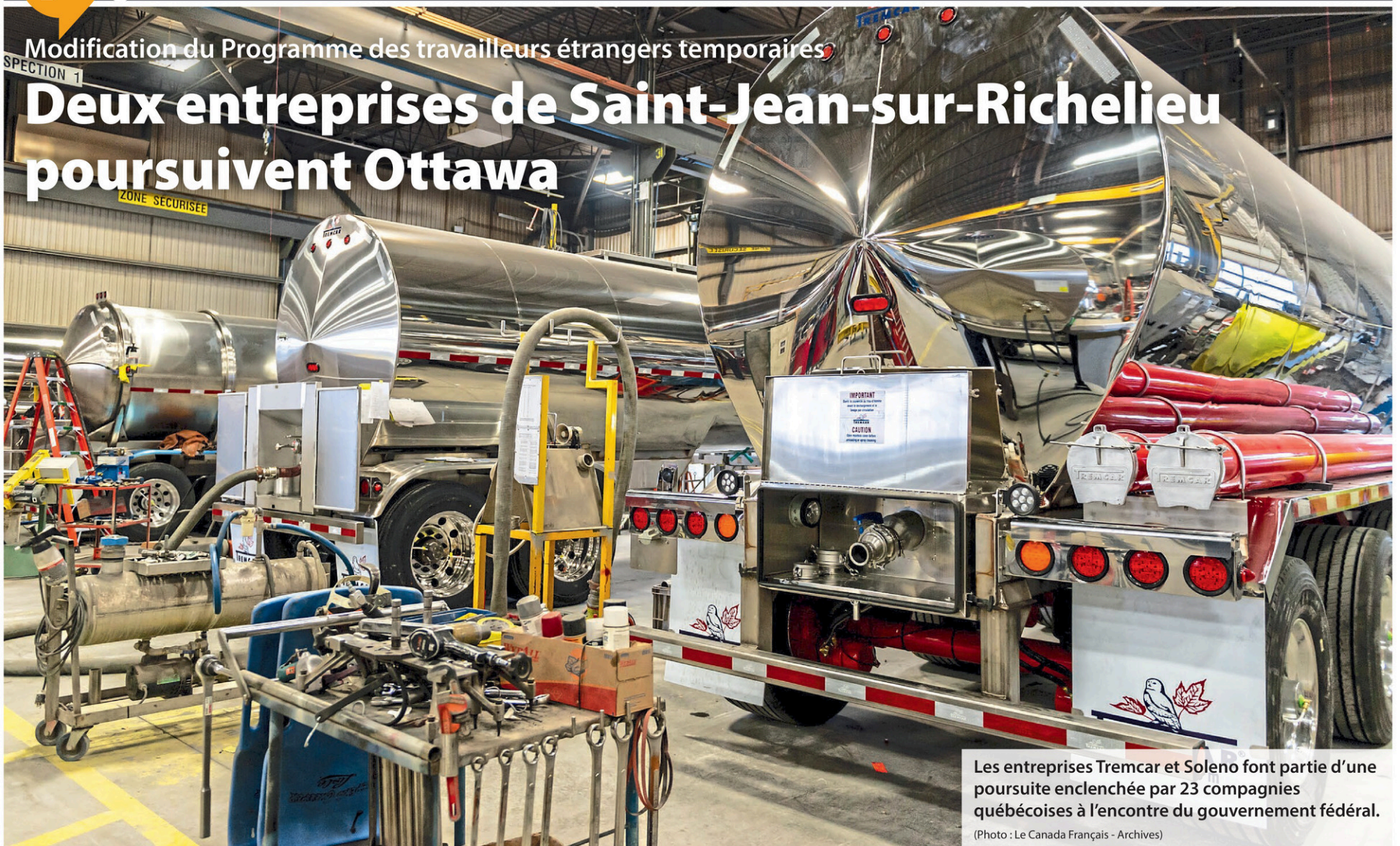
Les entreprises Tremcar et Soleno font partie d'une poursuite enclenchée par 23 compagnies québécoises à l'encontre du gouvernement fédéral.