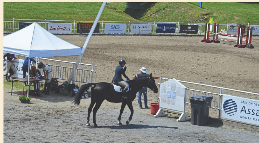
L'événement a lieu à compter de ce jeudi au Parc équestre olympique de Bromont.

Les Futurités sont organisées par Cheval Québec, avec la collaboration du gouvernement du Québec. Le ministère de l'Agriculture, des Pêcheries et de l'Alimentation aide financièrement cet événement via son programme d'appui aux expositions agricoles et sectorielles.