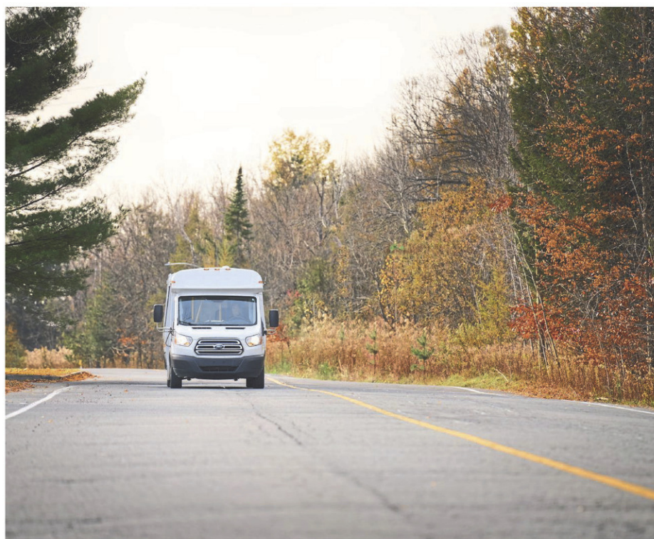
De nombreux projets pilotes sont en cours ou débutent bientôt dans la MRC de Brome-Missisquoi.