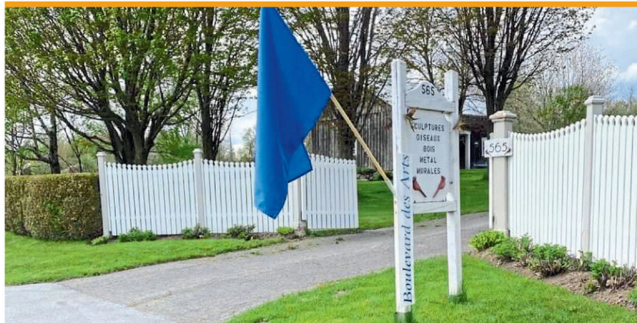
Le Boulevard des Arts prendra officiellement son départ le 5 septembre, mais le vernissage de l'exposition collective aura lieu le 30 août.