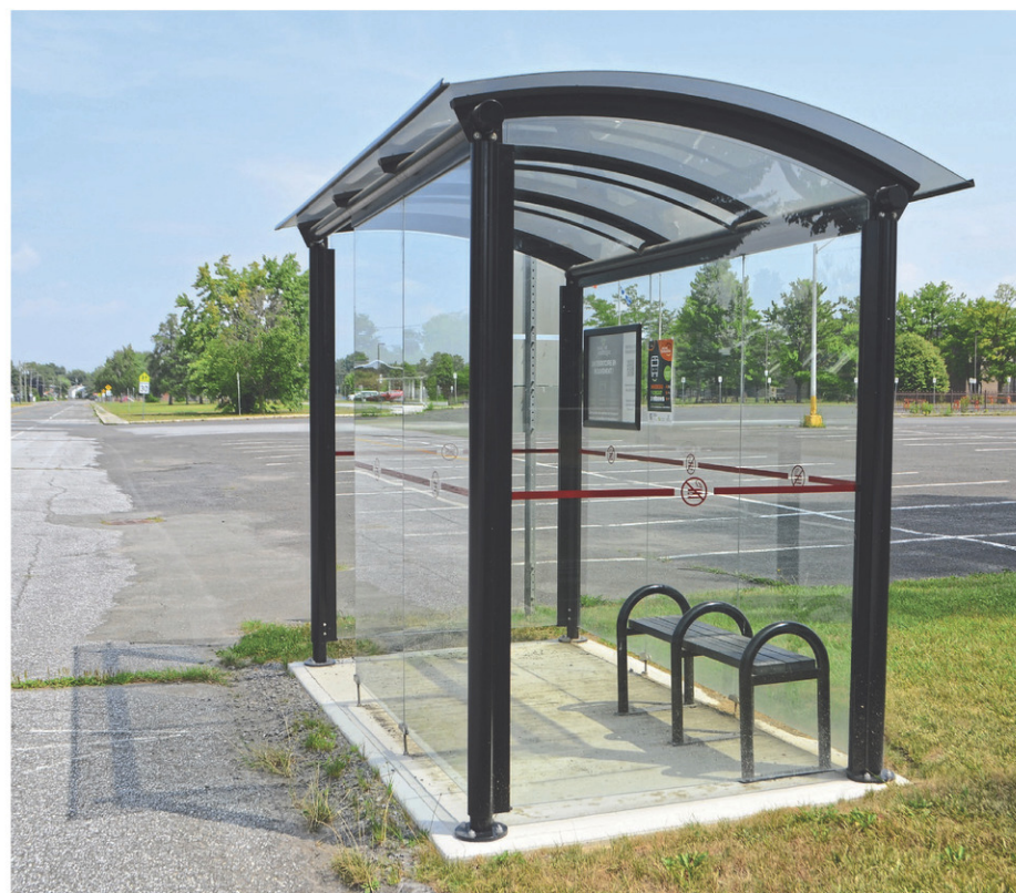
À Farnham, il y a quatre abribus pour accommoder les usagers du service de transport collectif. Il y en a 17 dans la MRC de Brome-Missisquoi.

Le journal a obtenu des chiffres sur les projets de transport de la MRC de Brome-Missisquoi. Pour le transport adapté, qui est le service le plus rodé, on parle d'environ 27 000 demandes annuellement partout dans la région. Quant au transport collectif intermunicipal, qui offre une connexion de n'importe quelle ville de la région à Cowansville, ce sont 35 000 déplacements