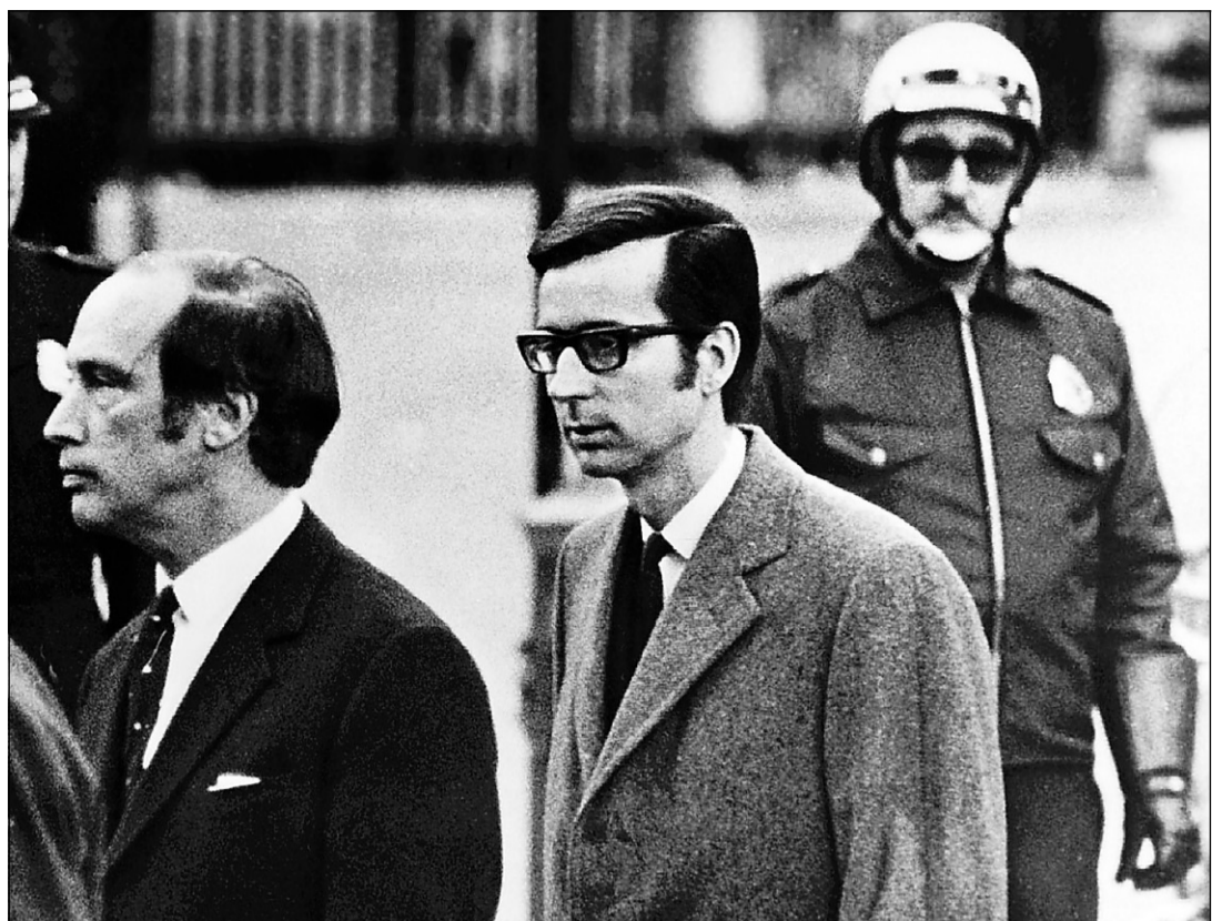
Splendeurs et misères : Jean Lesage, flanqué de ses ministres René Lévesque et Paul Gérin-Lajoie, lors de la réélection de l'équipe libérale en novembre 1962 (photo de gauche) ; Robert Bourassa assiste avec son homologue fédéral Pierre-Elliott Trudeau aux funérailles de son ministre Pierre Laporte, à l'automne de 1970 (photo de droite).