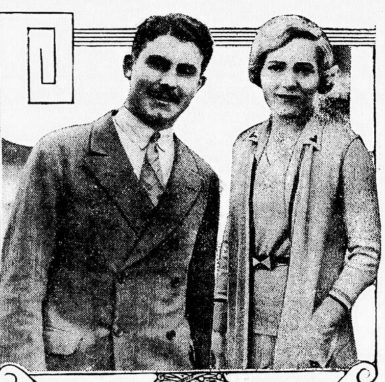
Intéressante photographie d'Alastair MacDonald, fils du premier ministre de Grande-Bretagne, et de Mary Pickford, à l'occasion d'une récente visite d'Alastair à Hollywood, où il assista à l'élaboration des vues parlantes.

BELGRADE, Yougoslavie, 21. — Un autobus transportant 25 voyageurs est tombé hier dans un ravin de 230 pieds de profondeur, près de Novisad. Cinq ont été blessés.