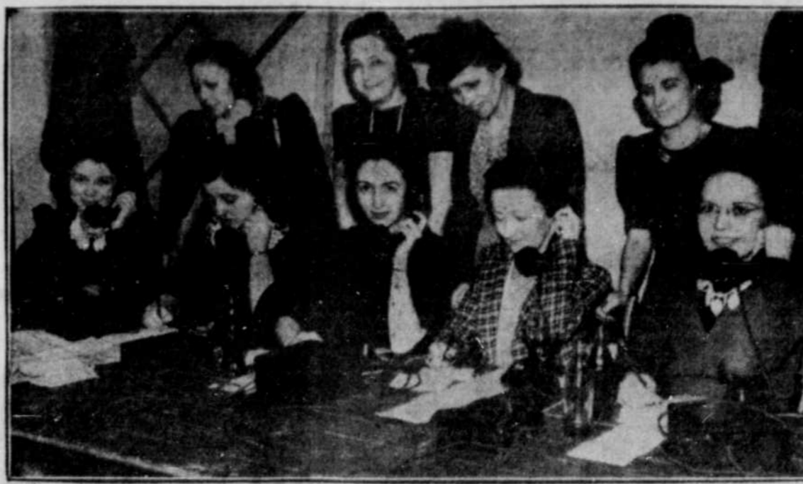
C'est ce soir que la population aura une dernière chance de participer au radio-encan du Y's Men's Club à CHLT, dont les bénéfices serviront à l'achat d'une ambulance de guerre. Ci-dessus le groupe de téléphonistes qui seront à la disposition du public pour recevoir les enchères.