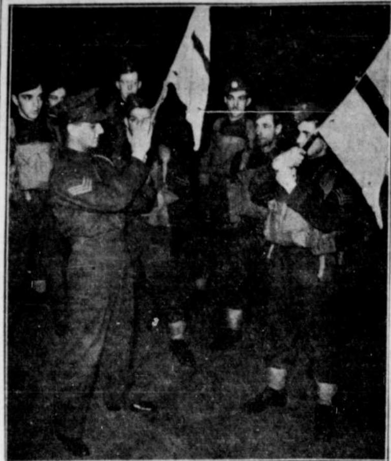
Un groupe de nouveaux sergents a suivi un entraînement intense au régime des Fusiliers de Sherbrooke afin de pouvoir prendre la place de ceux qui ont quitté ce titre de l'armée canadienne de réserve pour se joindre à l'armée active ou au Centre d'Entraînement, lorsque les Fusiliers reprendront leurs activités au début de l'été.