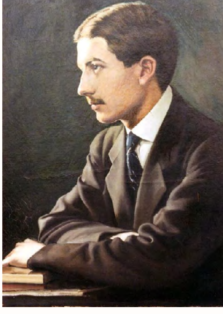
Henri-Alban Fournier, dit Alain-Fournier (1886-1914), en 1913.