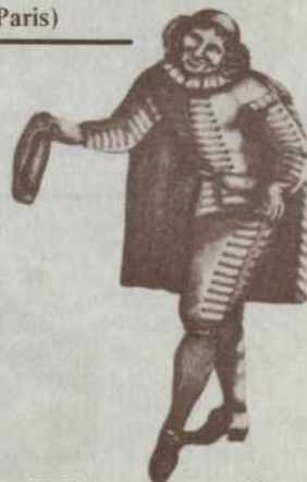
Molière en Sganarelle (par Simenon)

(IL Y AURA ENTRACTE ENTRE LE III e ET LE IV e ACTE)