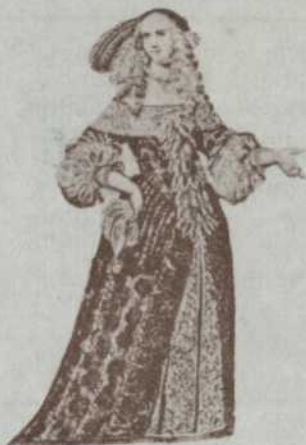
Madeleine Béjart (d'après A. Bossé)