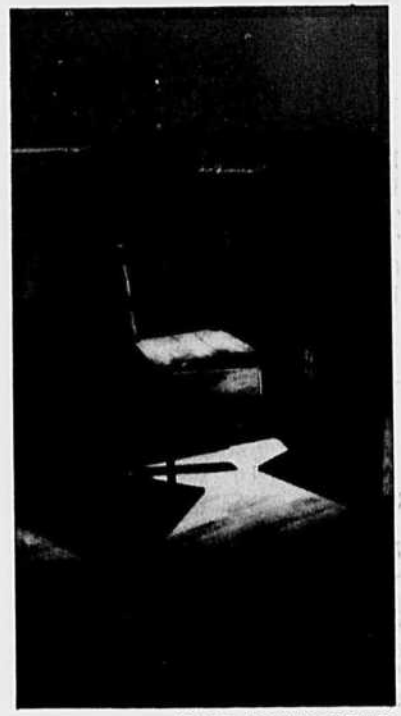
Iris , de Roberto Pellegriozzi.

Les 12 artistes de l'exposition ne sont pas tous des artistes dont Payant a, un jour ou l'autre, analysé les oeuvres. Les participants ont été choisis en fonction de la capacité de leurs oeuvres actuelles à répondre à la pensée de critique. et je dis bien répondre , pas se soumettre. Voyez, par exemple, la série de tableaux sur cuivre de Night Train , de Peter