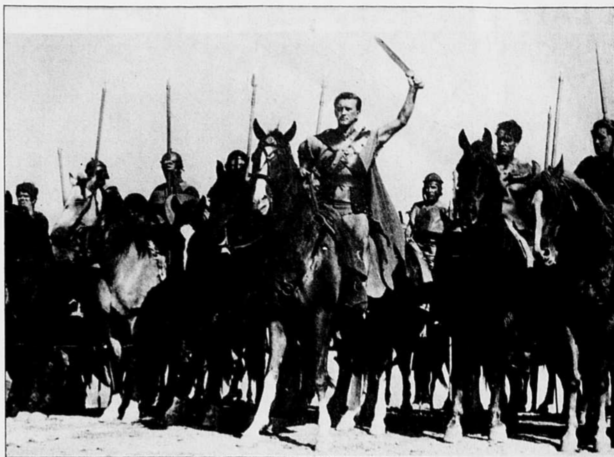
Kirk Douglas, qui joue le rôle de Spartacus, s'apprête à donner la charge lors d'une bataille épique.

Mais c'est dans la deuxième moitié du film que la relative indifférence du filmage se mue en cette ob-