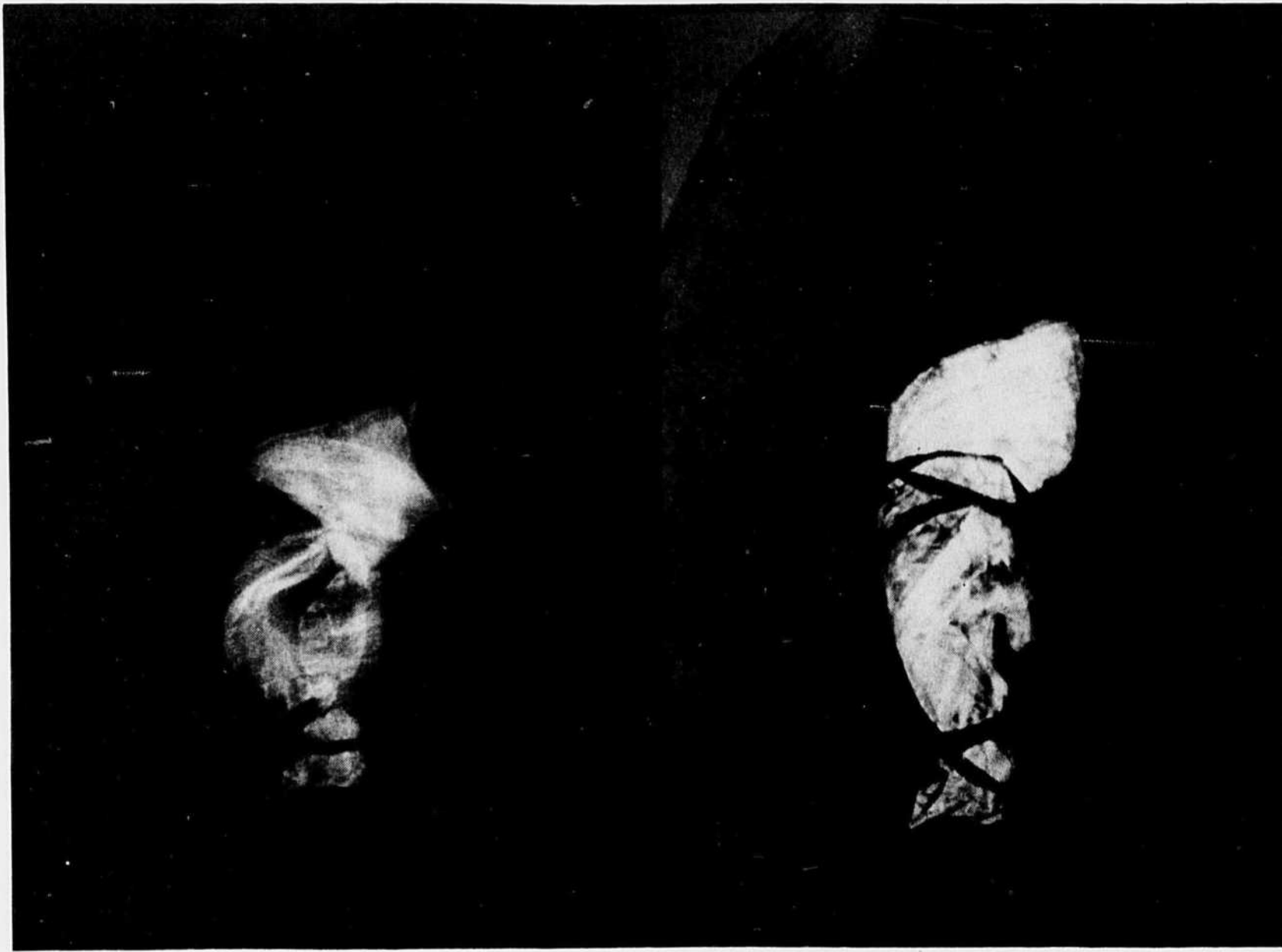
Le parfum de la Dame en Noir , d'André Martin.

Bien sûr, parce qu'il en est de la pensée comme il en est de l'oeuvre d'art, chaque regard particulier posé sur elle en modifie le sens originel. Nous n'évoluons pas en fonction des idées de tel ou tel auteur, mais en fonction de l'idée que nous nous faisons de ses idées, c'est cela dépenser l'héritage. Il existe donc, en chacun d'entre nous, et différent pour chacun, un legs Payant. Monter une exposition dans laquelle les oeuvres des artistes répondraient au texte