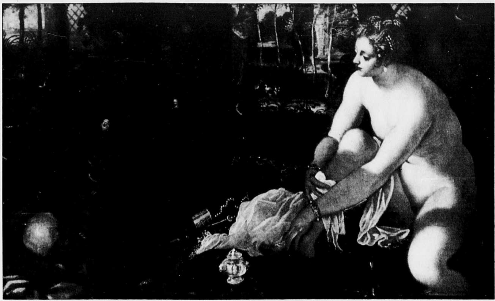
Suzanne et les vieillards.

L'un remplace le mur du jardin par un paysage d'Italie et supprime le tain du miroir pour que les yeux de la Suzanne plongent directement dans ceux du vieillard voyeur. Une autre a placé à côté de sa Suzanne quelques-unes des Demoiselles d'Avignon, et donné au vieillard vicieux du premier plan le visage de Picasso. Chez quelqu'un d'autre, le miroir qui,