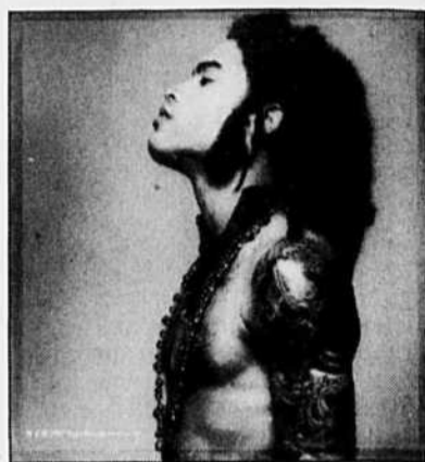
Goes Around Comes Around se fredonne sur l'air du Superfly de Curtis Mayfield, et ainsi de suite.

LA CRITIQUE n'est généralement pas trop tendre envers Lenny Kravitz, qui apparaît à plusieurs comme un pilleur de premier ordre, complètement obnubilé par la musique fin sixties et début seventies qu'il ressassait et recopie sans vergogne.