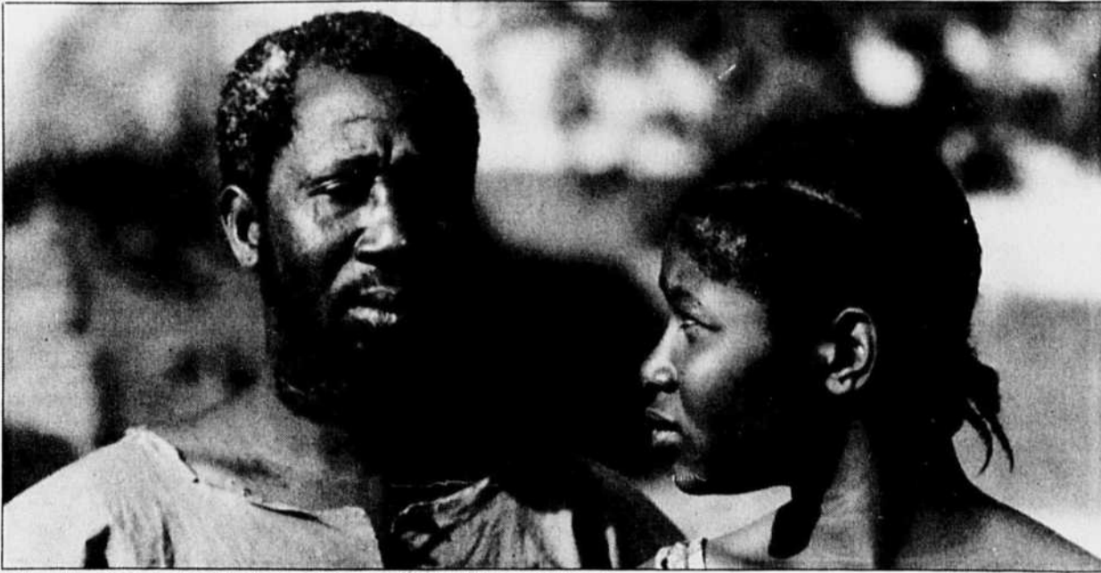
Tilai, d'après un scénario et une mise en scène d'Idrissa Ouedraogo.

CERTAINS FILMS relèvent presque de la grande tragédie antique et créent leur cadre ethnologique pour atteindre une portée universelle. Le très beau Tilai du burkinabé Idrissa Ouedraogo est de ceux-là : fort, impitoyable. Cette histoire grave à saveur archétypale explore les coutumes africaines pour mieux s'en délivrer, tirant de leur gavage folklorique les émotions profondes de l'âme humaine. Tilai n'en est pas à son premier voyage, puisqu'il remportait en 90 le prestigieux Grand Prix de Cannes.