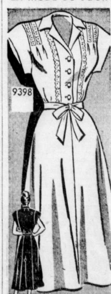
La petite robe fraîche pour les jours d'été! La dentelle étroite lui donne un air de jeunesse irrésistible.

Ce patron No 9398 est offert pour les tailles 34, 36, 38, 40, 42, 44, 46, 48, 50. La grandeur 36 requiert 4 1/2 verges d'un tissu de 35 pouces de largeur.