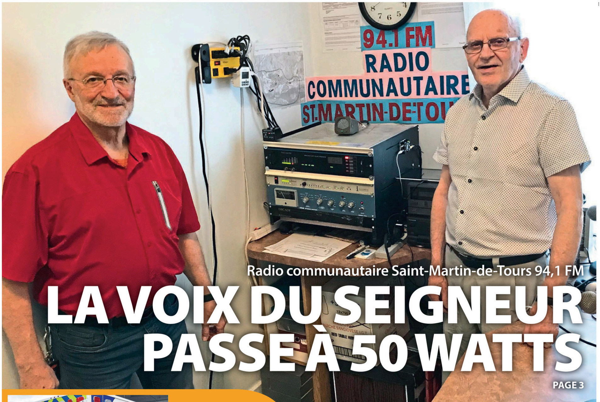
Radio communautaire Saint-Martin-de-Tours 94,1 FM

LE 7 JUILLET 2021 | Volume 84, N° 28 | 6 406 exemplaires