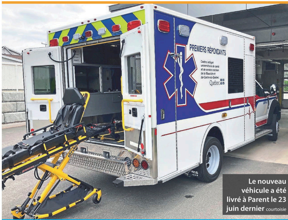
Le nouveau véhicule a été livré à Parent le 23 juin dernier courtoisie