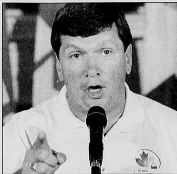
Le premier ministre Frank McKenna: «C'est effectivement une grande réussite d'obtenir l'engagement de 40 municipalités québécoises à «rester canadiennes».

Reconnaissant que le premier ministre Bouchard ne voulait pas en entendre parler, M. Filmon a toutefois ajouté que «ça ne veut pas dire que le reste d'entre nous ne partagera pas son propre point de vue là-dessus.» Il a précisé que M. Bou-