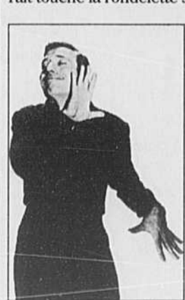
Yves Montand du temps de sa jeunesse