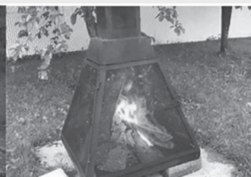
Feu dans un aménagement foyer extérieur, qui est muni d'un pare-étincelle et d'une cheminée PERMIS NON NÉCESSAIRE