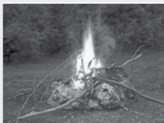
Feu à ciel ouvert PERMIS OBLIGATOIRE

Merci de faire de Saint-Henri une municipalité sécuritaire pour tous!