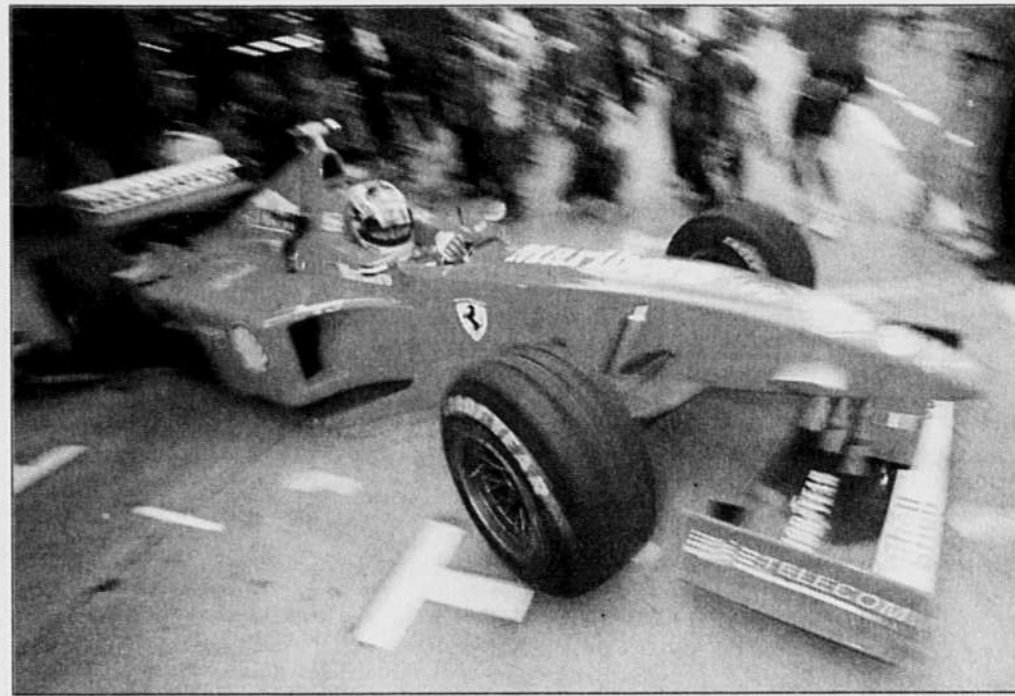
L'Allemand Michael Schumacher bondit hors du puit lors des essais libres du Grand Prix de Melbourne, en Australie. Il partira en deuxième ligne.