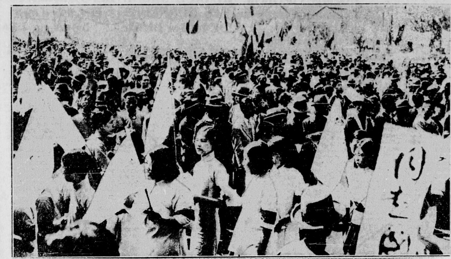
UNE PROTESTATION DES ÉTUDIANTS CHINOIS CONTRE LE JAPON. — On voit ici un groupe d'étudiants chinois protestant contre le Japon parce que ce dernier a établi un gouvernement autonome dans la Chine du Nord. On remarque que la foule des manifestants est particulièrement compacte.

Comme moyen de chauffage des cultures fruitières il est indicé d'employer le gaz, mais cela est très coûteux. Les ingénieurs agronomes français furent donc amenés à employer le charbon, par exemple un mélange de coke avec des briquettes agglomérées ou encore du goudron et de la houille. M. Geslin, lui, s'est rallié à l'emploi de boulets agglomérés qui, placés dans des brasses, donnent les cinq heures de chauffage nécessaires pour éviter la période critique du gel. Les boulets donnent en effet une élévation de la température proche de trois degrés presque toujours suffisante pour éviter les dégâts des grandes gelées printanières. Les agronomes utilisent aussi des produits résineux.