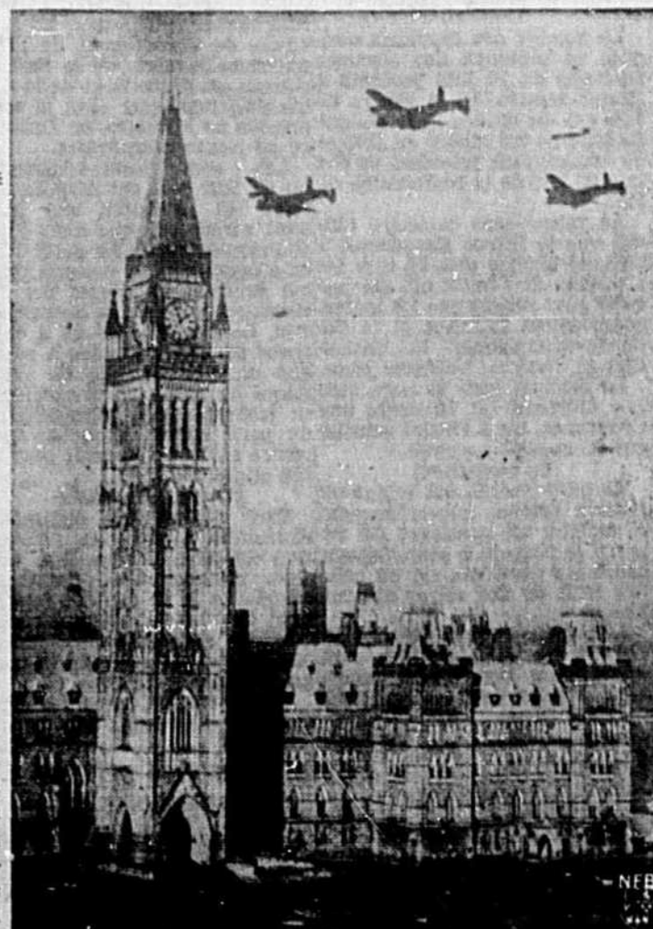
Le Parlement du Canada

Assistât qu'on a dissous le Parlement, (60 jours s'écoulent entre la dissolution des Cham-