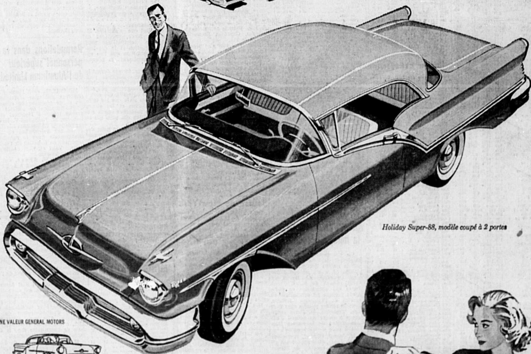
Holiday Super-88, modèle coupé à 2 portes

"Elle vous plaira encore davantage lorsque vous l'aurez achetée"