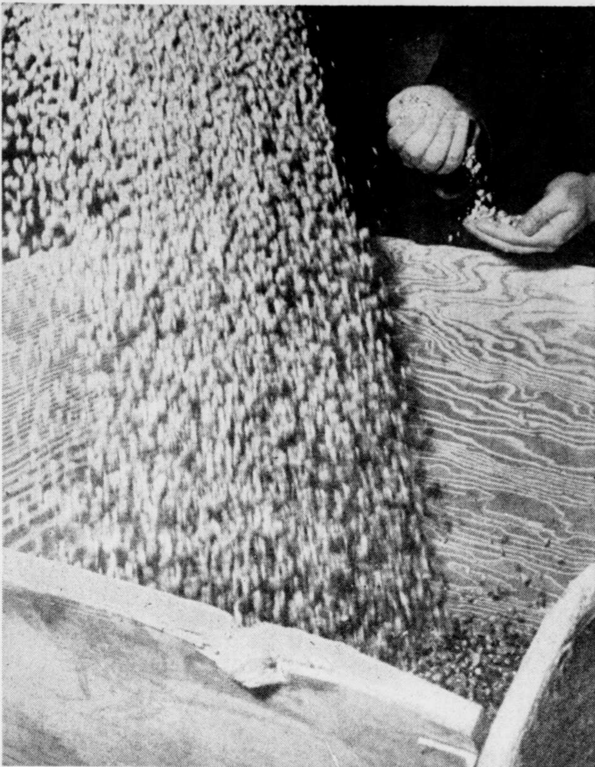
La Commission canadienne du blé, à compter du 1er août, pourra théoriquement vendre ses grains aux gens de l'est sur les mêmes bases que lors de ses transactions avec les étrangers.