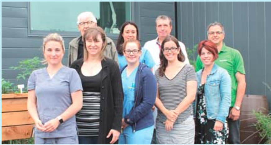
Les employés du département d'hémodialyse de l'hôpital sont reconnaissants envers leurs généreux donateurs qui ont permis la réalisation du jardin: la Ville de Montmagny, la MRC de Montmagny et le Centre horticole Beau-Site.