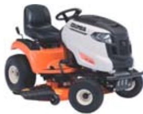
CYT4220SE TRACTEUR DE PELOUSE