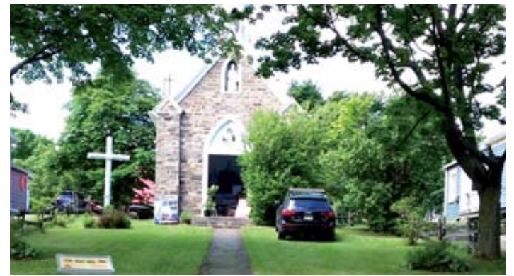
La chapelle des processions, ou la chapelle de Sophie, située sur l'avenue de Gaspé Est à Saint-Jean-Port-Joli.