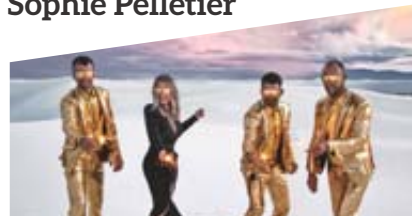
The Lost Fingers