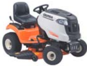
CYT4220 TRACTEUR DE PELOUSE