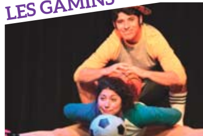
24 JUILLET À 13 H BOUGE › Cirque