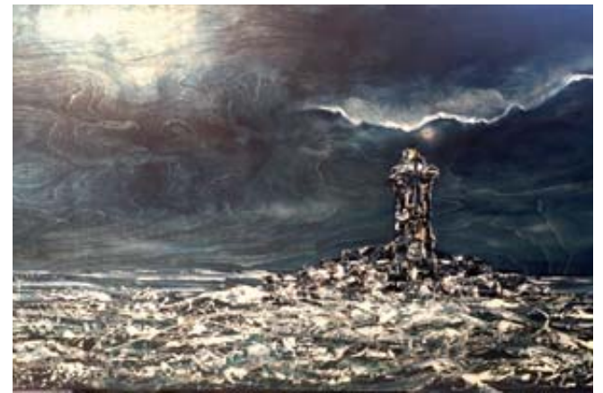
Illustrant le phare du Pilier de pierre en face de Saint-Jean-Port-Joli, ce tableau fait partie de l'exposition «Écumes» présentée à la bibliothèque de Montmagny. Le vernissage aura lieu le mardi 8 août entre 17 h et 19 h : l'artiste invite la population à y assister.