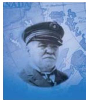
Le capitaine J.E. Bernier.