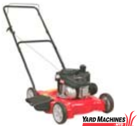
A02 TONDEUSE POUSSÉE

PLUSIEURS OPTIONS DE FINANCEMENT À 0 % DISPONIBLES. †