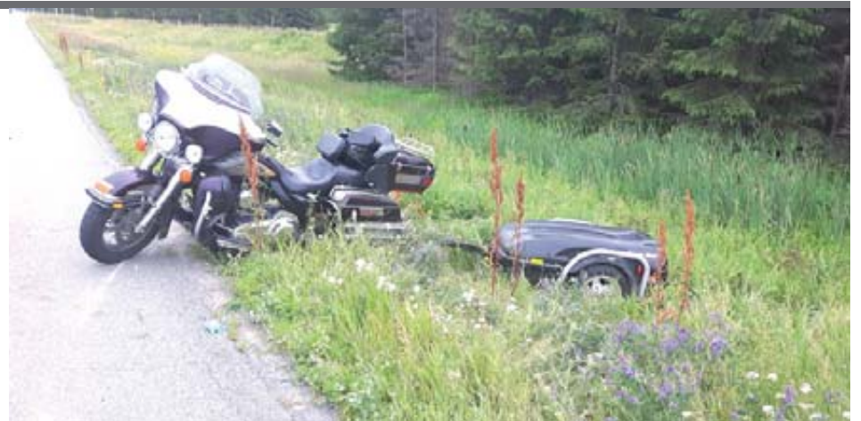
La passagère a subi de graves blessures dans cet accident.

Une voie de l'autoroute 20 à cet endroit a été fermée, ce qui a ralenti considérablement la circulation.