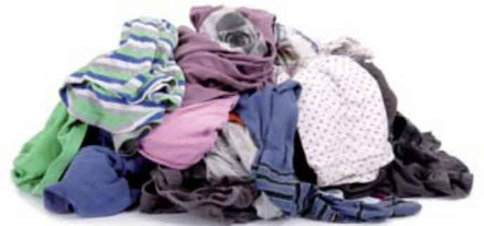
La collecte de textiles mise en place par l'Élan collectif vise à disposer du surplus de cette matière qui, au dernier stade de la récupération, sera acheminée et vendue à un centre de tri dans la région de Montréal.