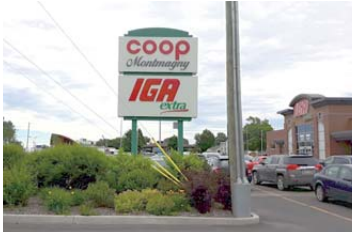
La borne du Circuit électrique d'Hydro-Québec sera située dans le stationnement du Magasin Coop IGA Extra de Montmagny.

Dans quelques mois, Montmagny disposera d'une borne de recharge rapide pour les véhicules électriques, a-t-on appris de la bouche du maire, Jean-Guy Desrosiers, lors de la dernière rencontre mensuelle avec la presse le 12 juillet. Envisagé depuis un an, le projet a été retardé à cause d'un changement de site. On a finalement trouvé un autre endroit pour installer ce service,