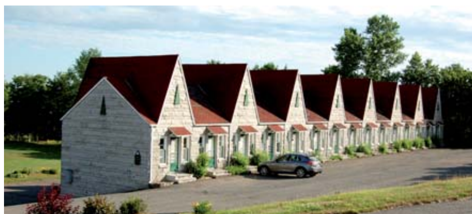
L'une des deux bâtisses qui logent les chambres de motel seront démolies pour faire place aux résidences.