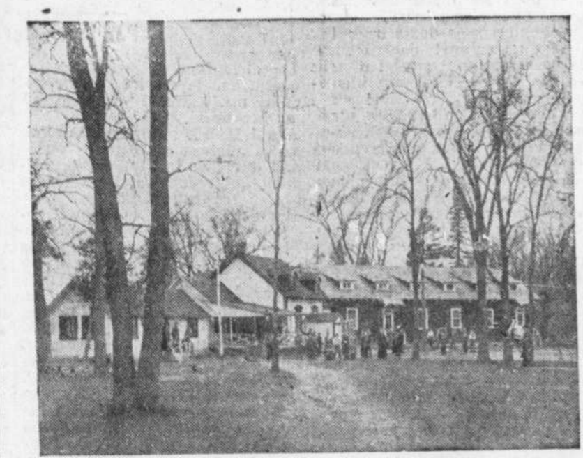
Le pavillon et les ateliers des garçons.

Nul domaine, plus que celui de l'île-aux-Cerfs que l'oeuvre acquerra en 1942, ne pouvait mieux répondre à la devise de l'Association catholique de l'Aide aux infirmes: Enseigner leur vie!