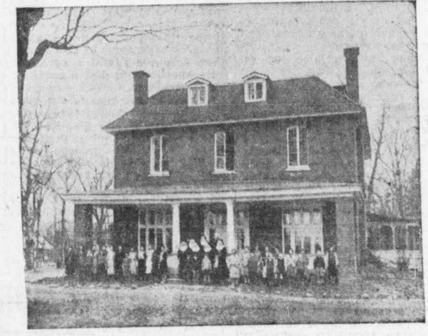
Le pavillon-école des fillettes

...Donc, le 27 octobre, au siège social de l'Aide-aux-Infirmes, no 1183, rue Saint-Mathieu, les Etablissements Notre-Dame prennent naissance en inaugurant une école primaire destinée exclusivement aux épileptiques éducatibles et à laquelle est attachée une clinique médicale suffisante pour parer au plus pressé.