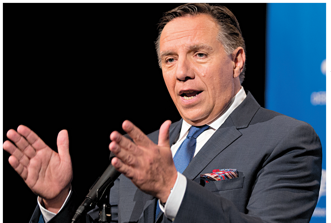
François Legault, fondateur et chef de la Coalition avenir Québec