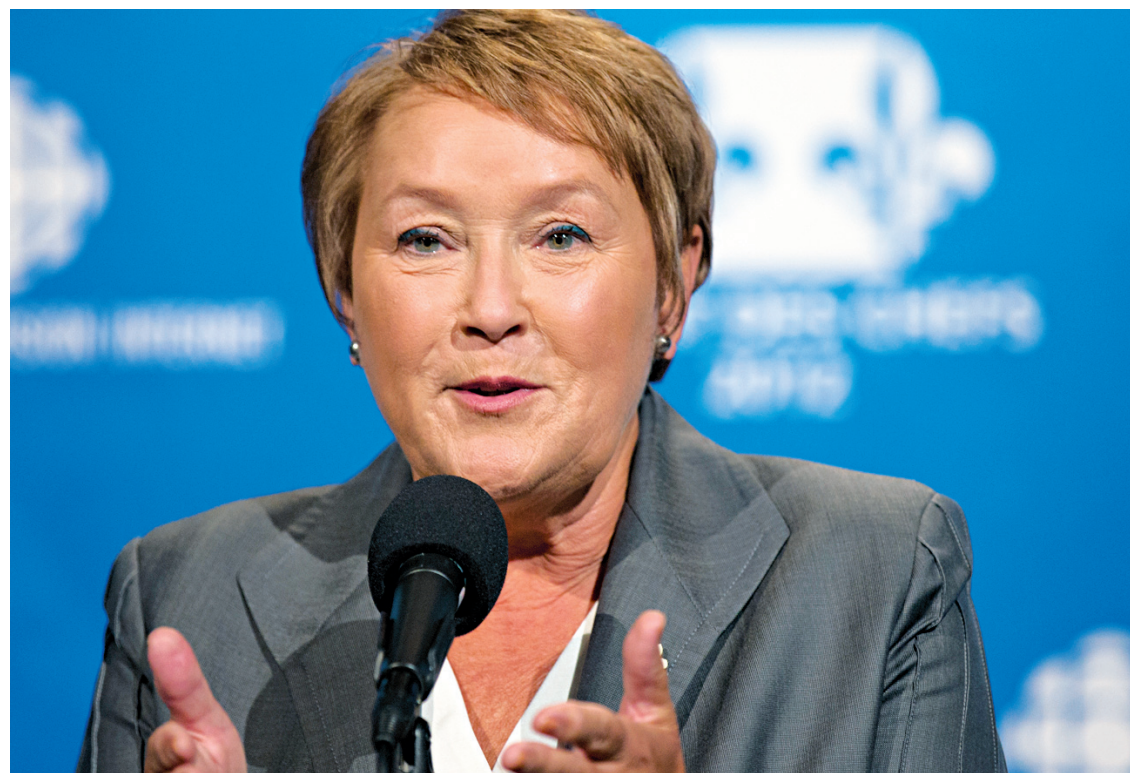
Pauline Marois, chef de l'opposition officielle du Québec

Toutefois, la seule correction possible à apporter à une telle situation consiste à interrompre la marchandisation de l'information, ce qui se fait en proposant, ce qui est peu rentable, la nécessité de l'effort, seule façon pour un individu d'agir en société selon un mode responsable.