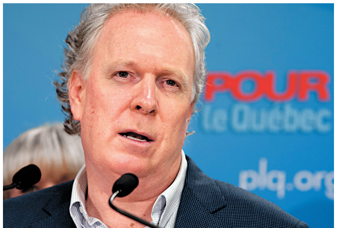
Jean Charest, actuel premier ministre du Québec