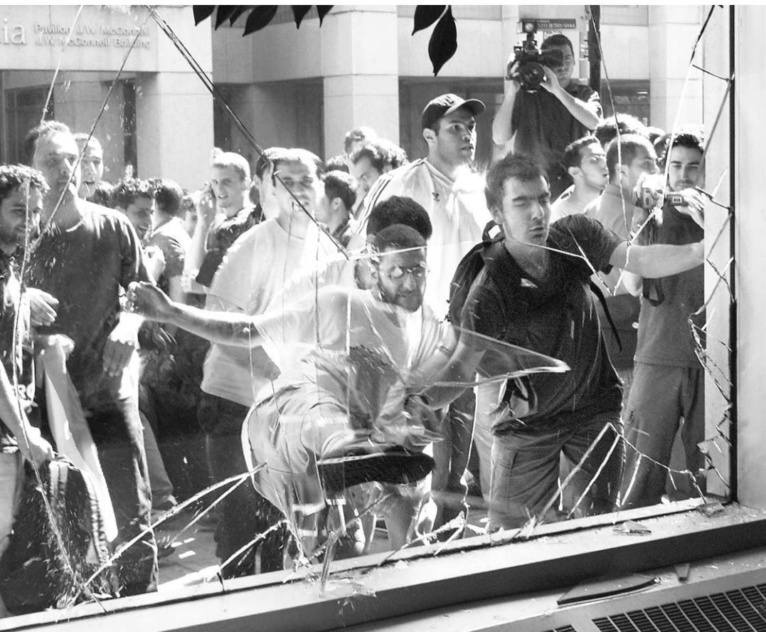
Une fenêtre du pavillon Hall de l'Université Concordia avait volé en éclats lors de la manifestation du 9 septembre dernier.

En distribuant ses prospectus, M. Engler protestait contre la décision prise quelques heures plus tôt par le conseil d'administration de l'université, qui a refusé de lever le