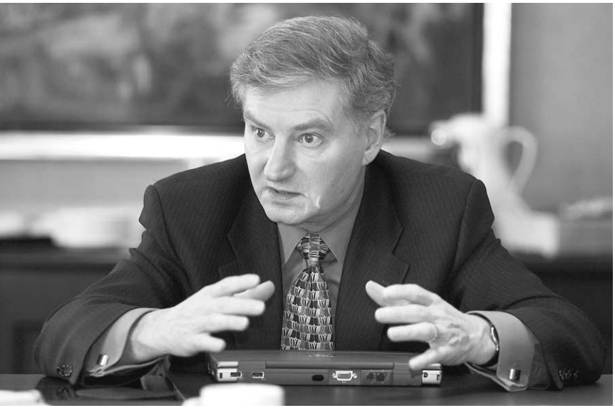
Le ministre des Transports, Serge Ménard.

M. Ménard note toutefois que, tout comme le prolongement de la ligne de train de Blainville vers Saint-Jérôme, annoncé la semaine dernière, le projet de Mascouche devra «franchir de nombreuses éta-