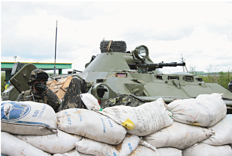
Un poste de contrôle de l'armée ukrainienne près de Slaviansk