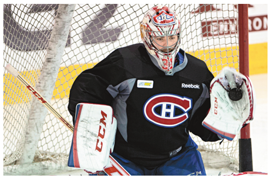
Carey Price: des «révélations» des Bruins?

Mais peut-être n'était-ce là qu'un simple clin d'œil plus ou moins narquois à l'intention des Bruins. Les exercices n'ont d'ailleurs duré que quelques minutes et Therrien est venu se placer dans le cercle de mise en jeu pour observer, l'air grave, comme s'il cherchait à attirer l'attention de tout le monde.