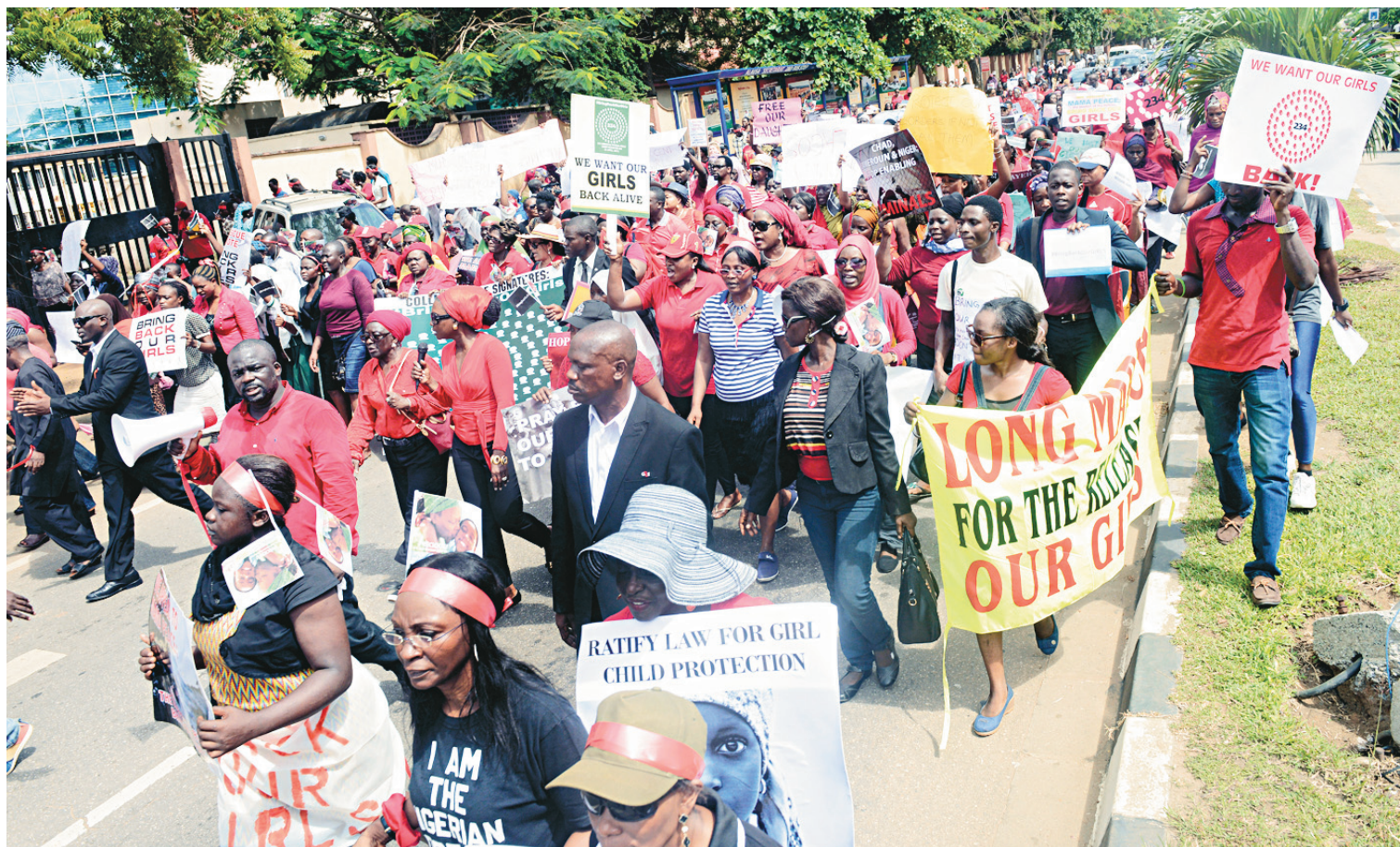
Une autre manifestation s'est déroulée lundi, à Lagos.