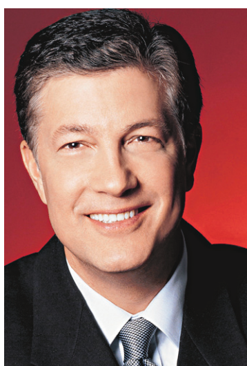
KRAUSE JOHANSEN ASSOCIATED PRESS Gregg Steinhafel

Ces décisions, qui ont un effet immédiat, interviennent environ cinq mois après l'opération de piratage informatique internationale et sophistiquée, dont Target a été victime. En décembre dernier, jusqu'à 110 millions de personnes avaient pu se faire voler des coordonnées bancaires ou per-