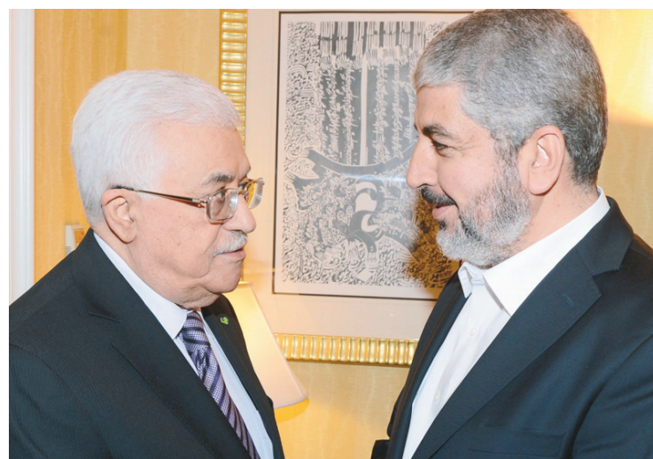
Mahmoud Abbas (à droite) et Khaled Mechaal lundi, à Doha

L'Organisation de libération de la Palestine (OLP) de