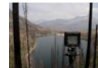
Production still, Waterton Lakes National Park → Voir cliché IX

Pour conclure, et afin d'illustrer les multiples réussites de Rutkauskas avec « After the Fire », j'aimerais aborder une photographie de production qui n'est pas incluse dans l'exposition. [ix] Il s'agit d'une représentation audacieuse de l'appareil photo Sinar de l'artiste, placé sur un trépied, surplombant la dévastation du feu de forêt Kenow, dans le parc national des Lacs-Waterton, en août 2018. Le photographe a ainsi documenté la technologie de fine pointe qu'il transporte à cet endroit pour contempler le territoire. Pour reprendre l'accent que met Eliasson sur l'incarnation d'un regard écologique, nous voyons ici l'appareil qui voit. Mais l'appareil photo ne voit pas réellement ; c'est l'artiste qui regarde à travers celui-ci, composant son image à l'aide de la grille de l'écran de visée bien en vue sur cette photographie. Rutkauskas voit avec cette grille, mais aussi à travers celle-ci. Cette photographie révèle la façon dont ses images sont construites afin que nous puissions comprendre plus globalement la matérialité et la culture des feux de forêt.