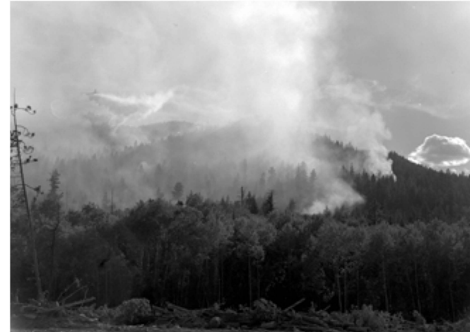
Le Martin Mars Water bombardant l'incendie Dean Fire en 1960. Image NA-20179, Archives du Royal BC Museum./Martin Mars Water Bombing Dean Fire, 1960. Image NA-20179 courtesy of the Royal BC Museum.

les paysages se transforment, se promener dans une zone fraîchement incendiée (en s'assurant au préalable qu'il est sécuritaire de le faire) et se trouver aux premières loges de l'émergence des fleurs sauvages, des buissons et des jeunes arbres, ainsi que du retour des oiseaux et des animaux, peut nous aider à percevoir le feu comme un agent de changement et de renouvellement du territoire avec lequel nous devons apprendre à composer.