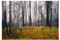
Kettle River Recreation Area (fire occurred in 2015, photographed in 2018) → Voir cliché IV