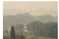
Similkameen River, August 15, 2018 → See plate VII