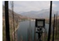
Production still, Waterton Lakes National Park → See plate IX