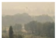
Similkameen River, August 15, 2018 → Voir cliché VII