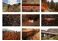
Retardant Grid → See plate VIII