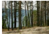
Okanagan Centre Fire (fire occurred in 2017, photographed in 2018) → See plate II

The Kenow fire [2] in Waterton Lakes National Park, in the south of Alberta, was sparked by lightning in August of 2017. It spread widely, burning almost 20,000 hectares in the park and destroying or compromising 80% of the road and hiking infrastructure. Rutkauskas’s photograph was taken a year later. We see no sky, no horizon, in fact, no obvious focal point in this sharply detailed work. The unorthodox, closed structure of the image is instrumental to the effect and information that Rutkauskas seeks to impart. Undirected by the photographer, viewers can and should ‘look