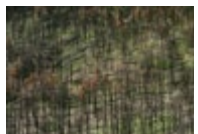
Elephant Hill Wildfire, Ashcroft, British Columbia (fire occurred in 2017, photographed in 2018) → Voir cliché VI