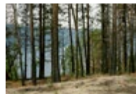
Okanagan Centre Fire (fire occurred in 2017, photographed in 2018) → Voir cliché II