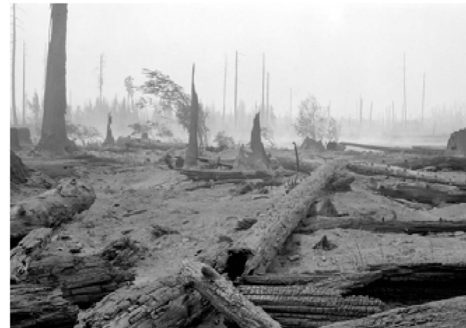
Forêt brûlée près de Merville après le passage d'un incendie en 1922. Image I-51799. Archives du Royal BC Museum./Burned out forest near Merville after a fire has passed through, 1922. Image I-51799 courtesy of the Royal BC Museum.