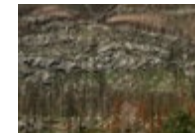
Kenow Wildfire , Waterton Lakes National Park, Alberta (fire occurred in 2017, photographed in 2018) → Voir cliché X

L'interface entre les êtres humains et la nature qui caractérise les feux de forêt est particulièrement évidente dans l'une des photographies les plus bouleversantes de l'exposition, Mount Christie Wildfire . [ix] Il s'agit à première vue d'une image convenue du feu qui a fait rage près de Penticton, en Colombie-Britannique, mais comme pour les autres photographies de Rutkauskas, cette impression s'estompe lorsqu'on y regarde de plus près. L'image a été saisie de l'autre rive du lac Skaha à l'époque de l'incendie, en août 2020,