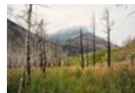
Crandell Mountain Campground, Waterton Lakes National Park (fire occurred in 2017, photographed in 2018) → See plate III

through, already pink with the late-summer-blooming willow herb, along the banks of the Kettle River. It is here that Rutkauskas's interest in the phenomenon of regeneration that characterizes the ecosystem takes on full meaning. The artist's documentation work has become one of the activities in a research project run by a team of scientists at the University of British Columbia Okanagan campus in Kelowna, called Living with Wildfire . 4 What is being contemplated as part of this research is a return to certain practices such as cultural burning—traditionally carried out by the Syilx People in this territory for millennia—to control the extent of fires. The ancestral burn techniques that were long banned by the authorities, on both the American and the Canadian side of the border, are now being reconsidered, by Parks Canada, among others, in the sites concerned.