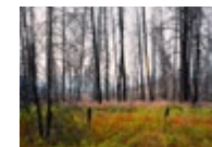
Kettle River Recreation Area (fire occurred in 2015, photographed in 2018) → Voir cliché XI