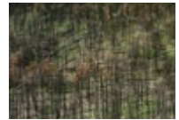
Elephant Hill Wildfire, Ashcroft, British Columbia (fire occurred in 2017, photographed in 2018) → See plate VI