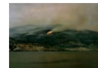
Mount Christie Wildfire (2020) → Voir cliché I