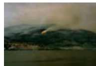
Mount Christie Wildfire (2020) → Voir cliché I