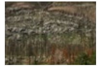
Kenow Wildfire, Waterton Lakes National Park, Alberta (fire occurred in 2017, photographed in 2018) → See plate V