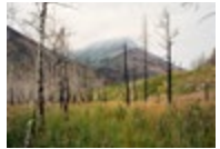
Crandell Mountain Campground, Waterton Lakes National Park (fire occurred in 2017, photographed in 2018) → Voir cliché III

L'œuvre vidéo Similkameen River, August 15, 2018 [7] est diffusée en boucle sur un écran plat de grandes dimensions. Cette œuvre, un plan fixe de format 16:9, a été tournée un peu au sud de Cawston, en Colombie-Britannique, près de la frontière canado-américaine. Une épaisse fumée y enveloppe la vallée que l'on imagine d'ordinaire pastorale de la rivière Similkameen. Le point de vue sur la scène, tout en retrait, laisse à peine voir la rivière, l'un de ses méandres apparaissant derrière un rideau d'arbres entrouvert. C'est d'ailleurs précisément dans cette ouverture que vient se ravitailler un hélicoptère qui fait son entrée dans le champ de la caméra après un peu plus d'une minute. Annoncé par le son de son moteur, l'appareil vient seul perturber l'immobilité apparente des choses. Plongeant dans