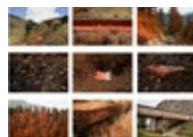
Retardant Grid → Voir cliché VIII