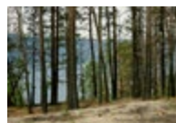
Okanagan Centre Fire (fire occurred in 2017, photographed in 2018) → Voir cliché II

Park (fire occurred in 2017, photographed in 2018) [3] et Kettle River Recreation Area (fire occurred in 2015, photographed in 2018) , [4] accrochées côte à côte, présentent une forêt après le passage du feu, déjà toute rose des épilobes de fin d'été, sur les bords de la Kettle River. L'intérêt que porte Rutkauskas au phénomène de régénération qui caractérise l'écosystème prend pleinement son sens. Ce travail de documentation s'inscrit désormais dans le contexte des activités d'un groupe de recherche que dirige une équipe de scientifiques de l'Université de la Colombie-Britannique Okanagan à Kelowna, Living with Wildfire . 5 Et c'est dans le cadre de ces recherches qu'est envisagé le retour de certaines pratiques comme le brûlis – pratiqué traditionnellement par le Peuple Syilx pendant des millénaires sur les lieux – pour contrôler l'ampleur des incendies. Les pratiques ancestrales de brûlis qui avaient été longtemps interdites par les autorités, tant du côté étatsunien que canadien, sont désormais reconsidérées, notamment par Parcs Canada, dans les sites concernés.