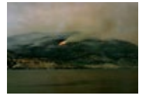
Mount Christie Wildfire (2020) → See plate I