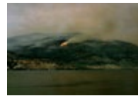
Mount Christie Wildfire (2020) → See plate I