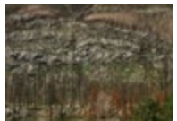
Kenow Wildfire, Waterton Lakes National Park, Alberta (fire occurred in 2017, photographed in 2018) → Voir cliché V