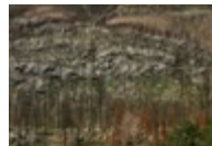
Kenow Wildfire, Waterton Lakes National Park, Alberta (fire occurred in 2017, photographed in 2018) → See plate II

around’ in rather than ‘through’ this image. Instead of a well-known view or sublime phenomena, we see the rocky contours of the land flattened before us. Trees stand where they were engulfed by flames, delineating the topography. Like the grasses at ground level that have returned to green, they are part of the rebirth of this area.