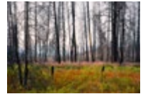
Kettle River Recreation Area (fire occurred in 2015, photographed in 2018) → See plate IV

Never formulaic or didactic, the images that comprise ‘After the Fire’ can be genuinely instructive. It is no wonder that Rutkauskas’s work is found in publications about wildfires, not as an ‘illustration,’