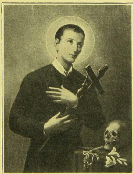
SAINT GÉRARD MAJELLA

De la Congrégation du Très-Saint-Rédempteur (1726-1755)