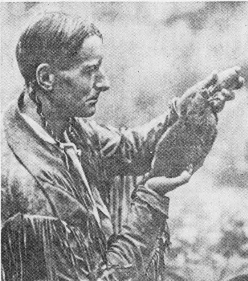
Grey Owl nourrissant un castor âgé d'une semaine.