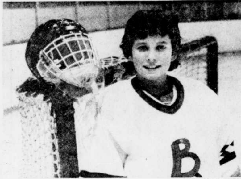
Manon Rhéaume aime mieux être gardien que gardienne...

"Quand j'étais jeune, je jouais continuellement avec les garçons, moi-même. Pour une seule raison: leur degré d'habileté et de performance."