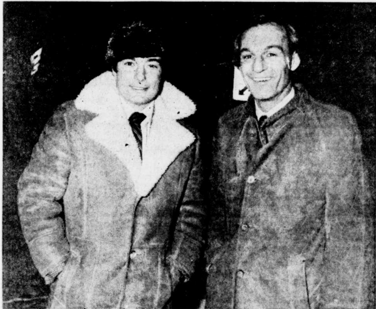
Steve Shutt (à gauche) avec son 400e but en carrière et Guy Lafleur avec son 500e, ont réussi l'exploit mardi soir contre les Devils. Soulagés d'un poids énorme, ils devraient être à leur meilleur pour l'affrontement contre les Nordiques ce soir.

"Ce qu'il faut retenir de cette transaction, a poursuivi Lafleur, est que la direction fait des efforts pour bâtir une équipe valable. C'est encourageant de savoir que les dirigeants essaient de bâtir pour longtemps. Je ne dirais pas que nous avons maintenant tous les atouts pour réussir, parce que notre défensive est inexpérimentée, mais nous sommes engagés sur la bonne voie."