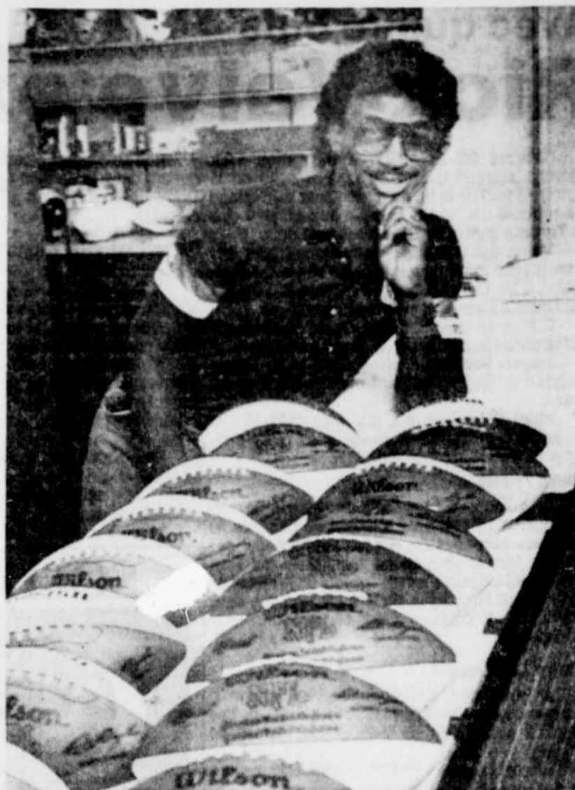
Eric Dickerson prend un moment de repos dans le vestiaire des Rams après qu'il ait été choisi recrue offensive de l'année par l'agence de presse Associated Press.

Clark s'est blessé à un genou lors du dernier match de la saison régulière, lundi contre les Cowboys de Dallas. L'entraîneur-chef Bill Walsh a indiqué que Clark pourrait subir une intervention chirurgicale.