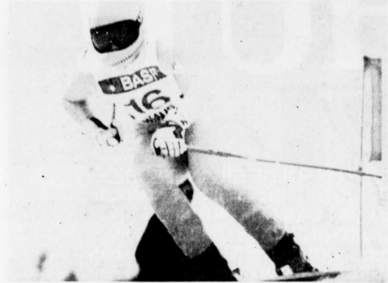
Hanni Wenzel du Liechtenstein a remporté la descente féminine disputée hier à Haus en Autriche.