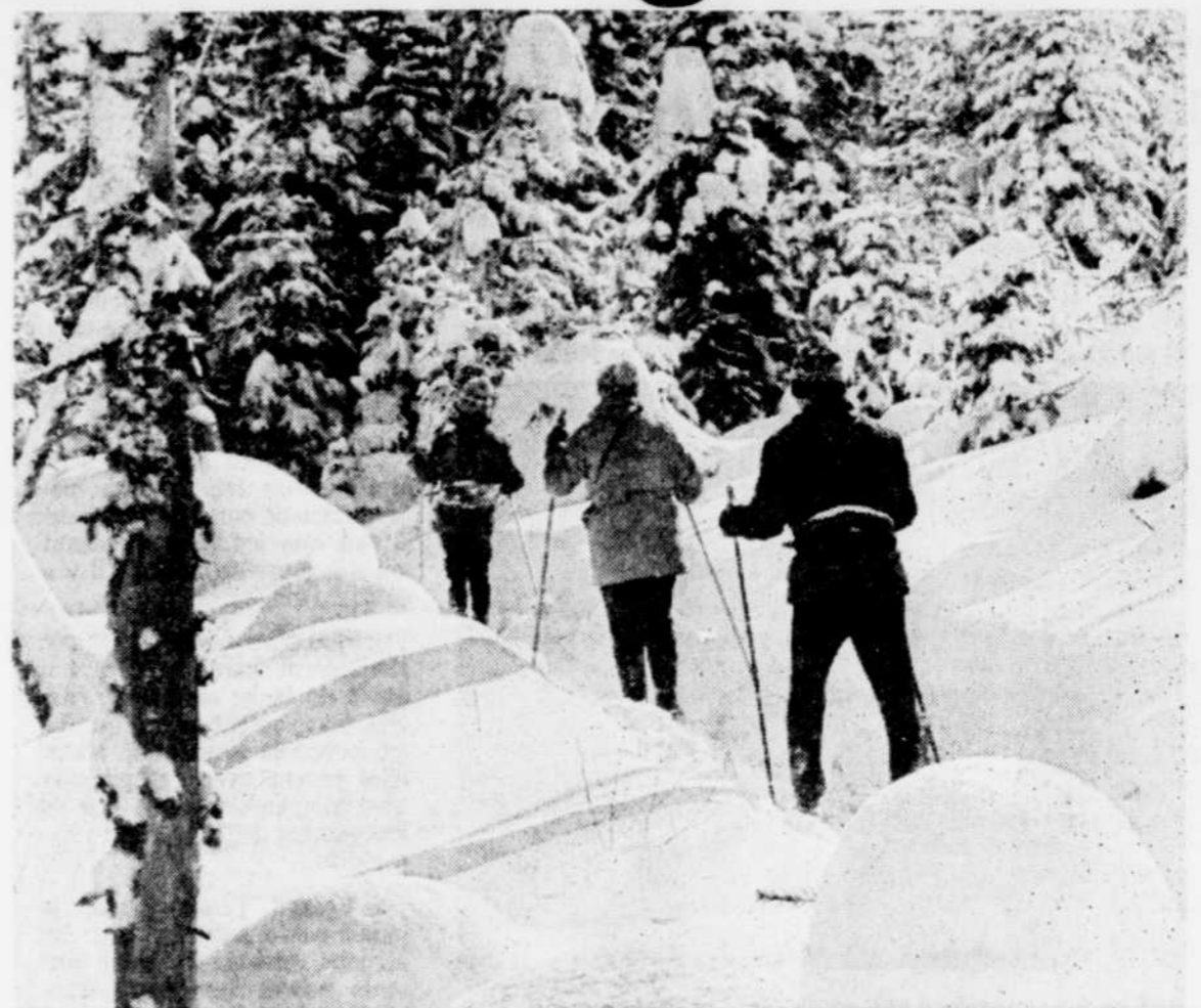
Un paysage féérique qui fait rêver et qui nous donne l'envie de sauter sur nos planches et de nous rendre à notre centre de ski de fond préféré.