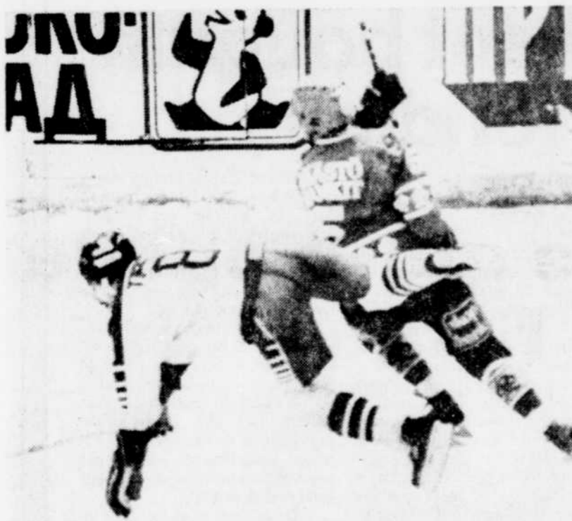
Une bonne pirouette pour le joueur canadien Dave Tippett lors du match disputé contre la Finlande. D'ailleurs tout le tournoi des Izvestia a été une monumentale culbute pour l'équipe du Canada qui a été incapable de remporter un match.