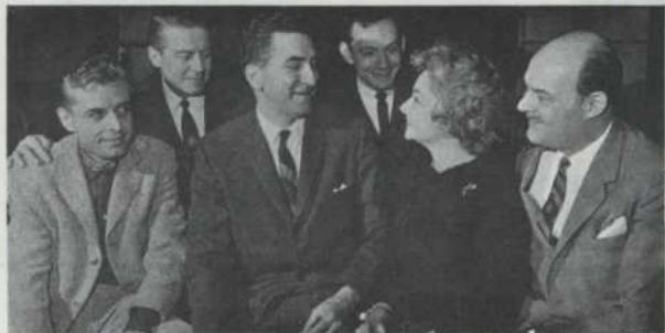
Les responsables de la saison artistique '64