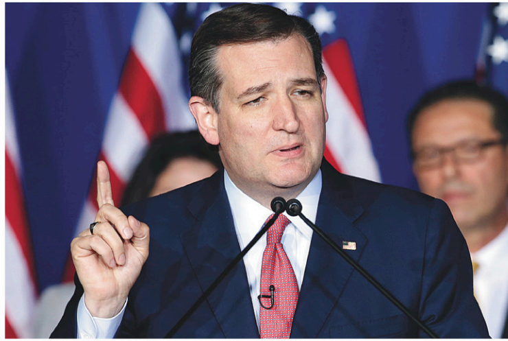
Ted Cruz a jeté l'éponge après avoir perdu dans l'Indiana.

Prenant acte de la nouvelle configuration au sein de l'arène républicaine, le président du parti, Reince Priebus, s'est rendu à l'évidence en déclarant tout de suite après, sur Twitter: « Donald Trump sera le candidat probable du GOP, nous devons tous nous unir pour battre Hillary Clinton », ajoutant le mot-clic « #NeverClinton ». L'establishment du parti, qui a longtemps été à couteaux tirés avec le milliardaire, se range ainsi derrière lui et appelle les membres du parti à faire de même.