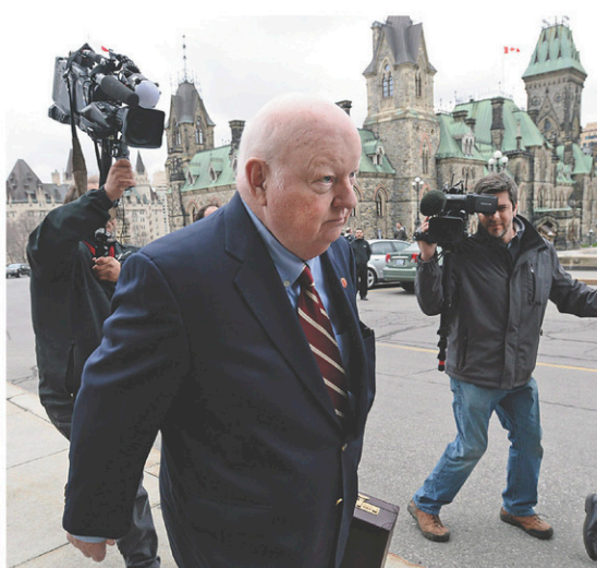
SEAN KILPATRICK LA PRESSE CANADIENNE

Le sénateur Tkachuk dit qu'il ne s'est pas joint au comité de régie interne avant le 10 février 2009. «C'est important que les gens sachent que je n'étais pas là en train de donner des