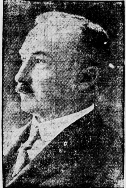
SIR CLIFFORD SIFTON, politicien canadien en vue, décédé subitement ce matin à New-York.