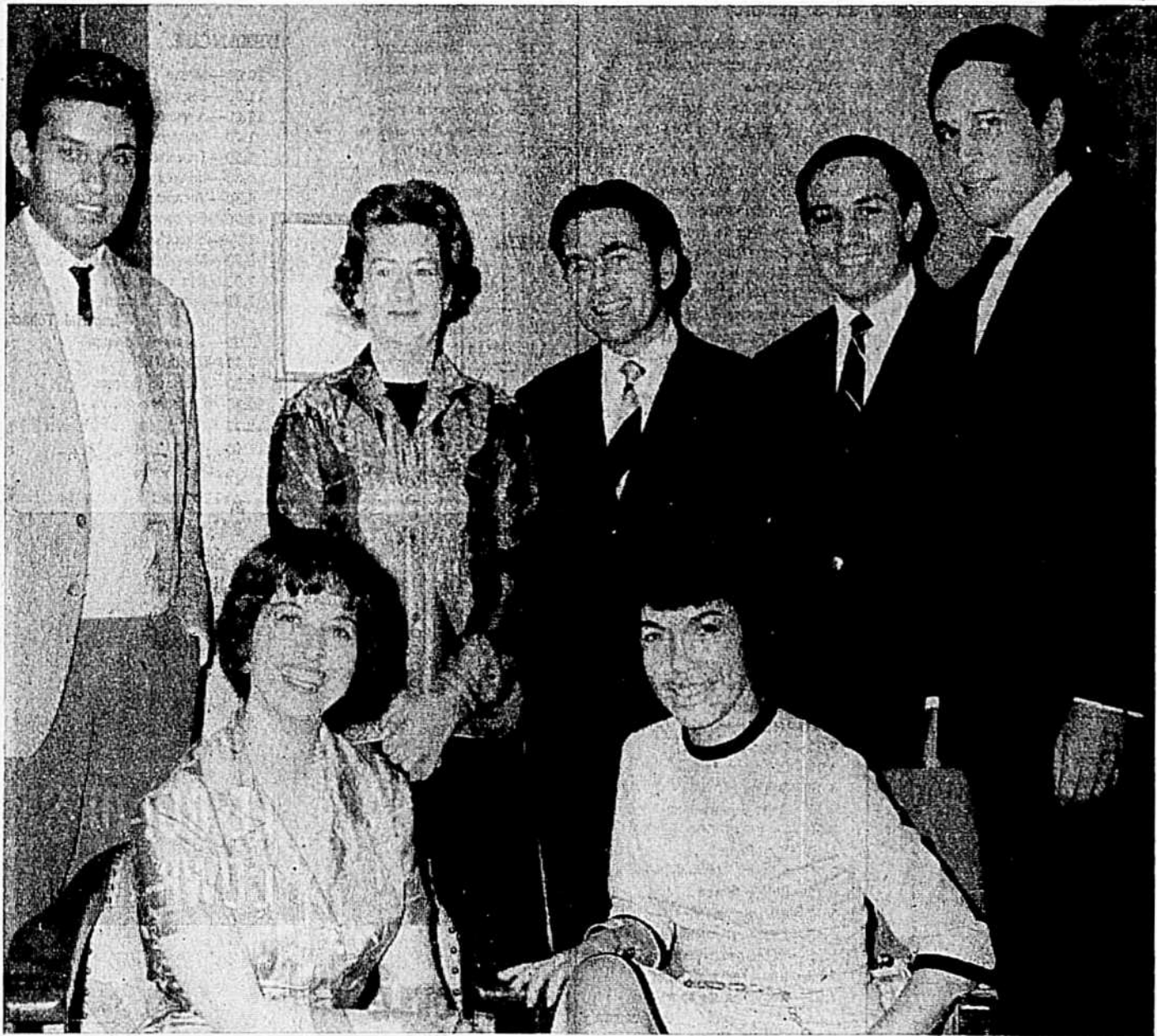
Les DOUBLE-SIX sont ici photographiés en compagnie de notre rédactrice, à l'occasion de leur visite-surprise chez les hebdos en congrès, au Lac Beauport.