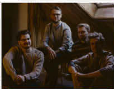
Bel Ours 26 juillet