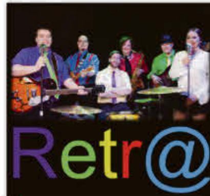
Rétra 9 août