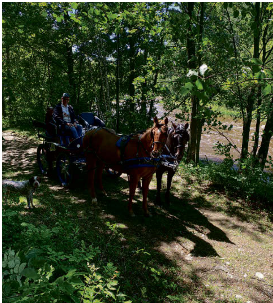
Le Club équestre de la MRC d'Acton célébrera en août son 20 e anniversaire avec l'activité « À cheval pour la cause ».