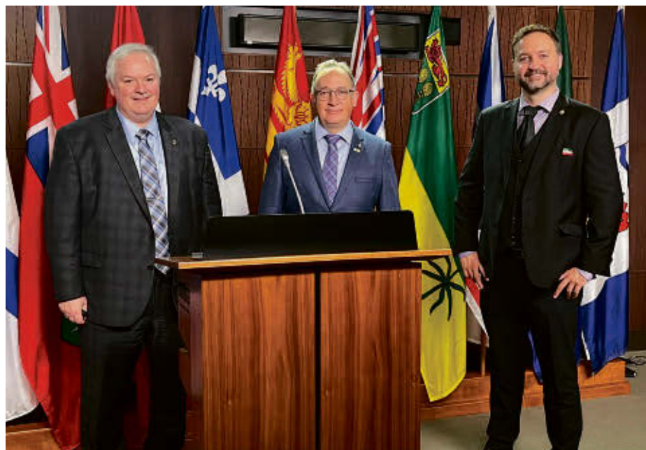
De gauche à droite : Luc Thériault, député de Montcalm, Yves Perron, porte-parole du Bloc québécois en matière d'Agriculture, et Simon-Pierre Savard-Tremblay, député de Saint-Hyacinthe—Bagot.

Plus de 600 entreprises agricoles québécoises opèrent selon le modèle de la gestion