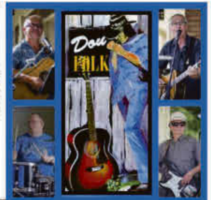
DouFolk 19 juillet