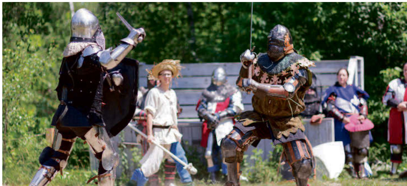
Le Festival médiéval fantastique Médiévalys, à Béthanie, célébrera durant le week-end sa 10 e édition.

Samedi soir, le site de Médiévalys sera l'occasion de souligner la Fête nationale, avec de 20 h à 23 h les groupes Flutin et Estreya (musique et danse médiévale), Rosheen (musique celtique et irlandaise) et La Défer-