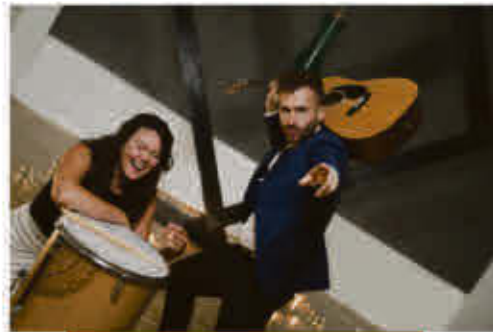
River and Blocks 5 juillet