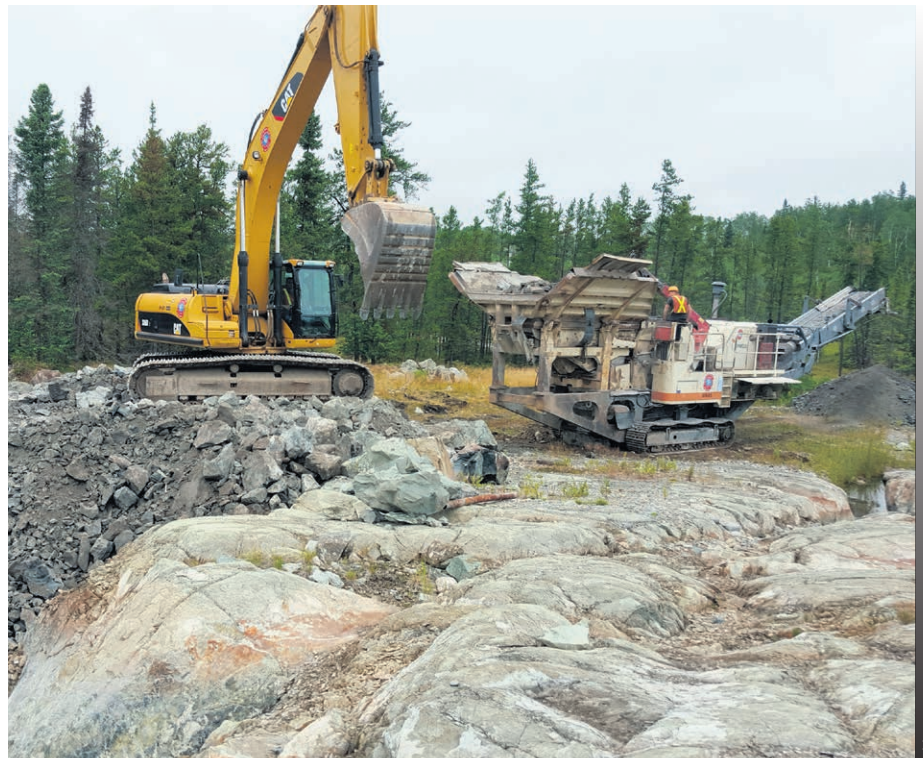
Le projet Dumont a reçu du fédéral près de 5 M$ pour poursuivre son étude de faisabilité en vue de produire du concentré de cobalt et de nickel pour la filière batterie.

Quant au projet Dumont, il s'agit, une fois de plus, de nouvelles encourageantes pour l'entreprise, qui décidera l'an prochain du sort du site, situé à Launay. L'entreprise a