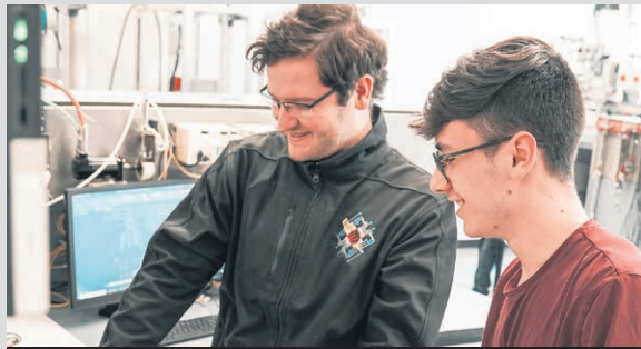
Le Cégep de l'Abitibi-Témiscamingue propose des approches novatrices et flexibles pour répondre aux besoins de sa population étudiante, du marché du travail, et de la société.

Il ne s'agit pas du premier projet du Cégep de l'Abitibi-Témiscamingue sur le continent africain. L'implantation de cette nouvelle AEC à Kédougou témoigne de la volonté de l'institution collégiale à exporter son savoir-faire et se positionner en tant que leader de l'enseignement international. Ce projet est rendu possible grâce à un appui financier de 750 000 $ du Programme Québec-Francophonie en formation technique. Le Programme Québec-Francophonie en formation technique a pour objectif de positionner les Cégeps comme des leaders de l'enseignement technique à l'échelle de la francophonie. Ce programme, doté d'une enveloppe de 10 millions de dollars sur trois ans, vise également à aider les entreprises québécoises à faire face à la pénurie de main-d'œuvre en contribuant au développement d'un enseignement technique de qualité dans des pays francophones ciblés. La première cohorte du