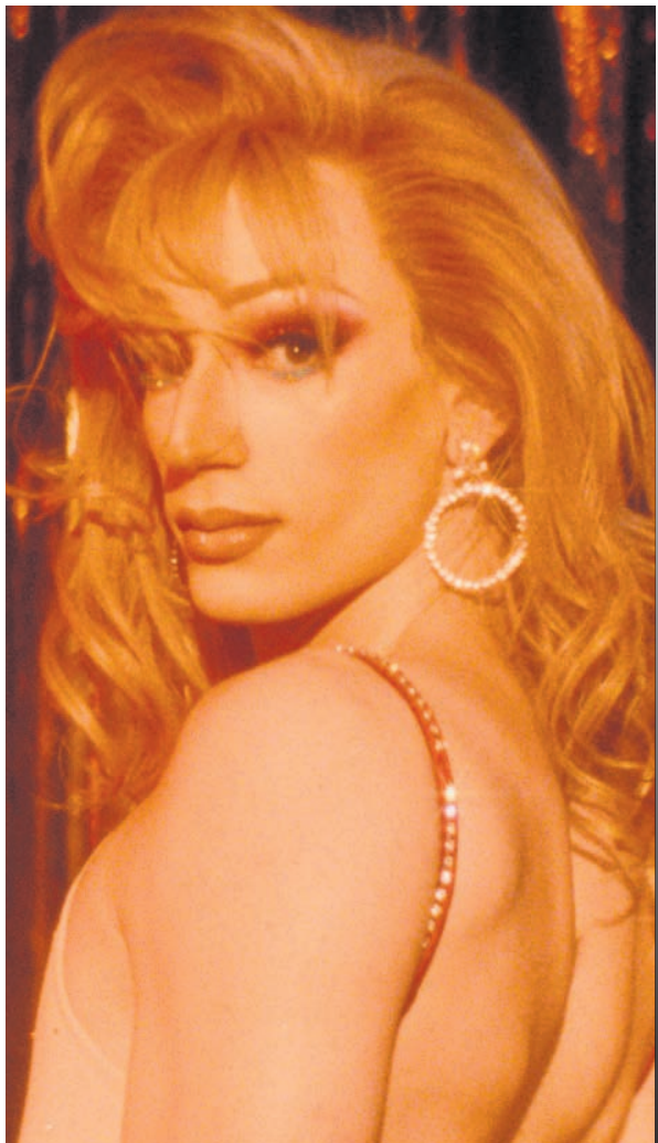
Théodore Pellerin est en nomination dans la catégorie Meilleure interprétation dans un premier rôle dramatique pour son rôle de Simon dans le film Solo.