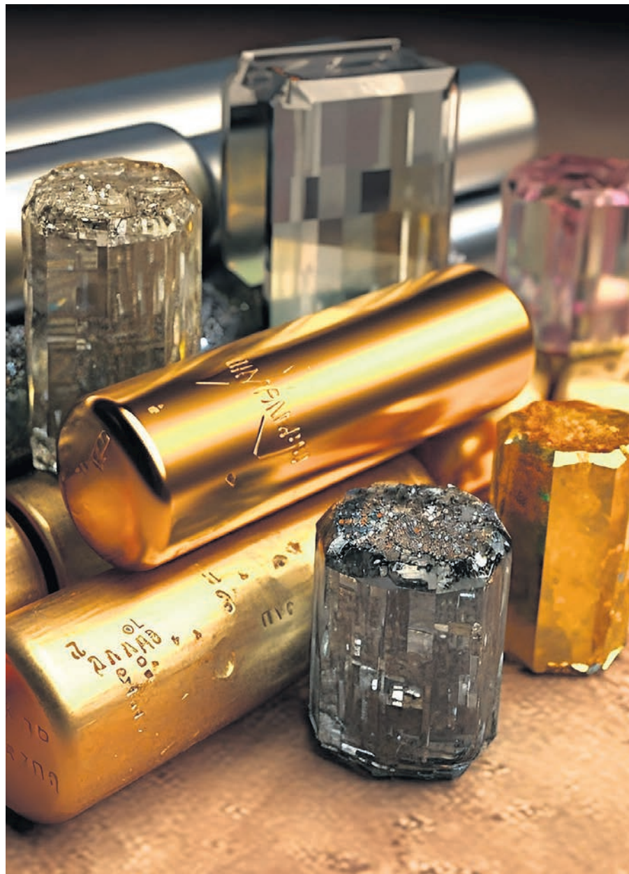
Deux projets de recherche régionaux bénéficieront d'un appui financier de Québec afin de développer la filière des MCS dans la province.