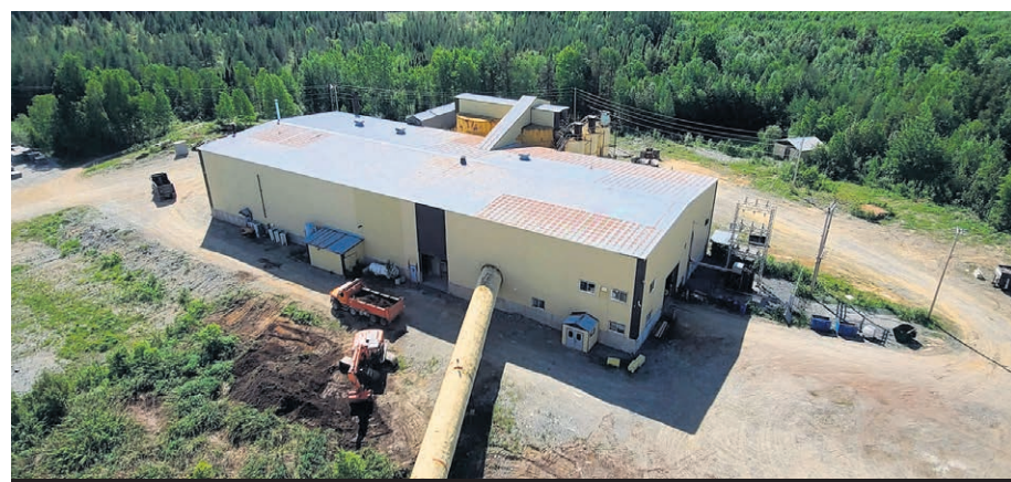
La Mine Beaufor change de mains une fois de plus. Cette fois, c'est Probe Gold qui en devient propriétaire.

Monarch a également annoncé la vente de sa propriété Swanson à Bullrun Capital, une société d'investissement canadienne qui se spécialise dans les investissements miniers, surtout le lithium par les temps qui courent. Là aussi, la transaction doit obtenir l'aval de la Cour supérieure, via la Loi sur les arrangements avec les créanciers des compagnies. La propriété Swanson est située à une cinquantaine de kilomètres au nord de l'usine Beacon, à l'est de Val-d'Or. Monarch avait elle-même fait l'acquisition de cette propriété, il y a six ans, des mains d'Agnico Eagle.