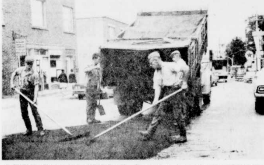
ENTRETIEN DE LA RUE NOTRE-DAME — Des travaux de pavage sont présentement en cours sur la rue Notre-Dame, principale rue commerciale de Victoriaville. Les embouteillages créés par la présence inhabituel du rouleau compresseur et de camions transportant la matière à revêtement, seront éliminés, d'ici peu, laissant une circulation toujours dense. Mais les véhicules rouleront désormais sur une surface nouvelle.