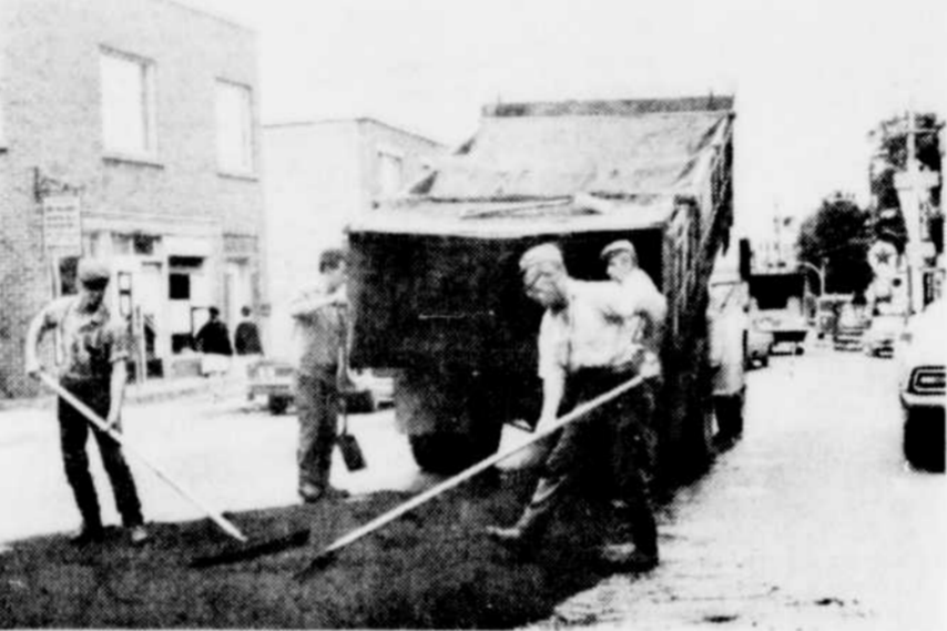
ENTRETIEN DE LA RUE NOTRE-DAME — Des travaux de pavage sont présentement en cours sur la rue Notre-Dame, principale rue commerciale de Victoriaville. Les emboîtages créés par la présence inhabituel du rouleau compresseur et de camions transportant la matière à revêtement, seront éliminés, d'ici peu, laissant une circulation toujours dense. Mais les véhicules rouleront désormais sur une surface nouvelle.