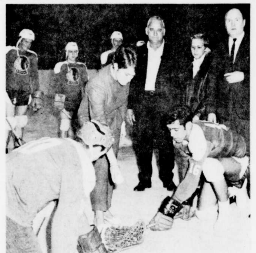
Ouverture officielle des Eperviers de Magog — Les Eperviers de Magog, de la nouvelle Ligue de Crose des Cantons de l'Est, ouvriront officiellement leur saison jeudi soir dernier, alors qu'ils affronteront les Tigres de Cowansville.