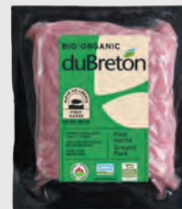
DU BRETON PORC HACHÉ BIOLOGIQUE