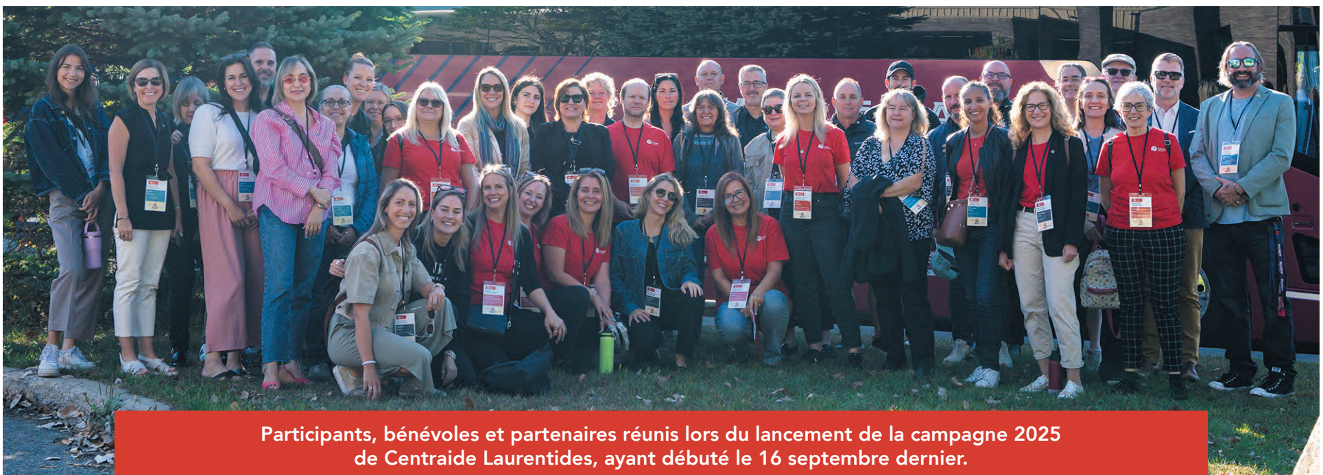
Participants, bénévoles et partenaires réunis lors du lancement de la campagne 2025 de Centraide Laurentides, ayant débuté le 16 septembre dernier.