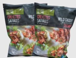
MARINA DEL REY CREVETTES SAUVAGES D'ARGENTINE