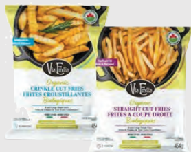
VIA EMILIA FRITES BIOLOGIQUES