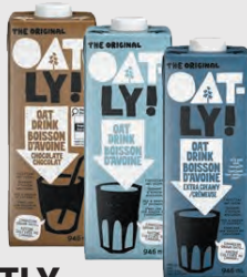
OATLY BOISSON D'AVOINE