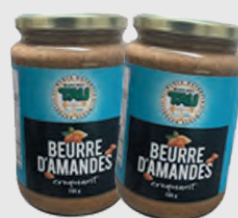
TAU BEURRE D'AMANDES