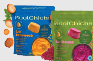
KOOLCHICHE PASTILLES DE HUMMUS SURGELÉES