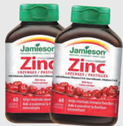
JAMIESON PASTILLES DE ZINC