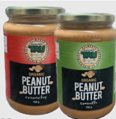
TAU BEURRE D'ARACHIDES