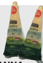
SANT'ANNA PARMIGIANO REGGIANO BIOLOGIQUE AFFINÉ 24 MOIS