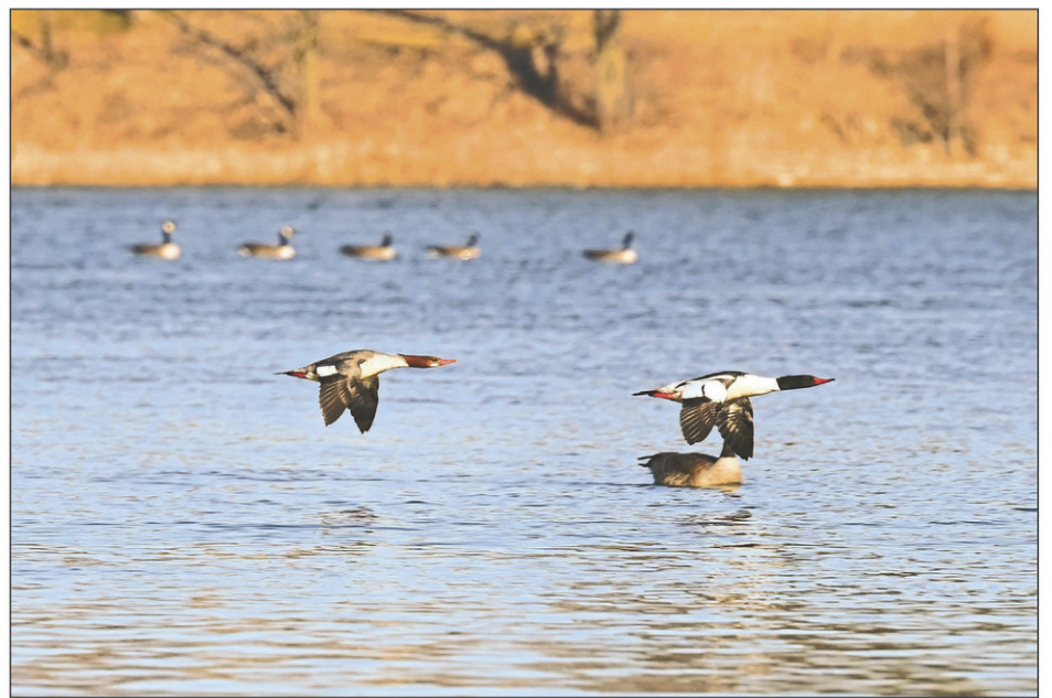
L'espèce est reconnaissable pour être très loquace en vol et cacarder en chœur.