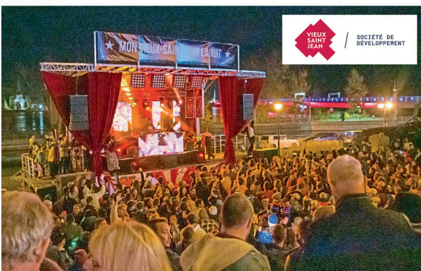
VIEUX SAINT JEAN / SOCIÉTÉ DE DÉVELOPPEMENT