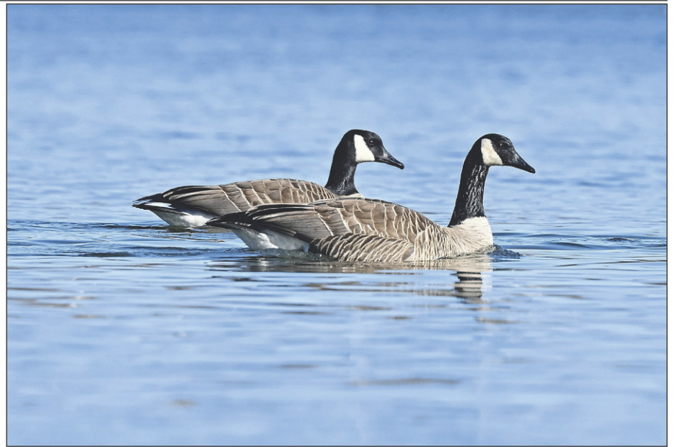
On peut observer plusieurs de ces oiseaux migrateurs sur la rivière Richelieu.