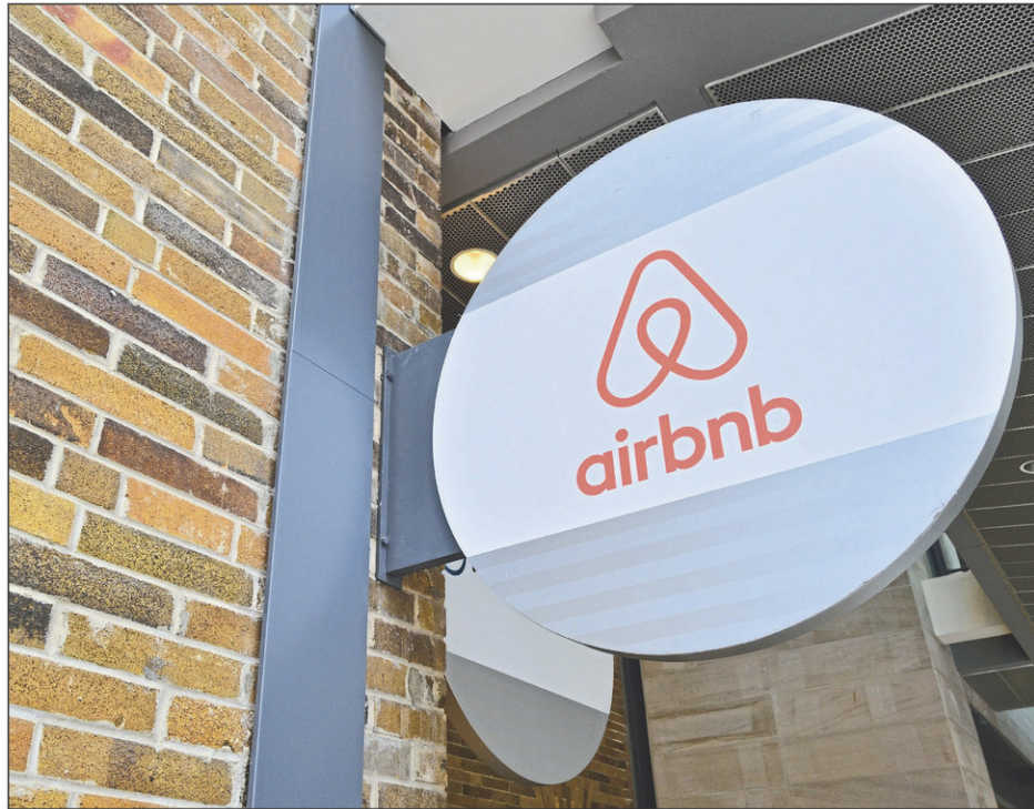
En février, un dénombrement réalisé sur Airbnb a permis de comptabiliser 112 annonces dans le Haut-Richelieu, dont 82 étaient illégales.