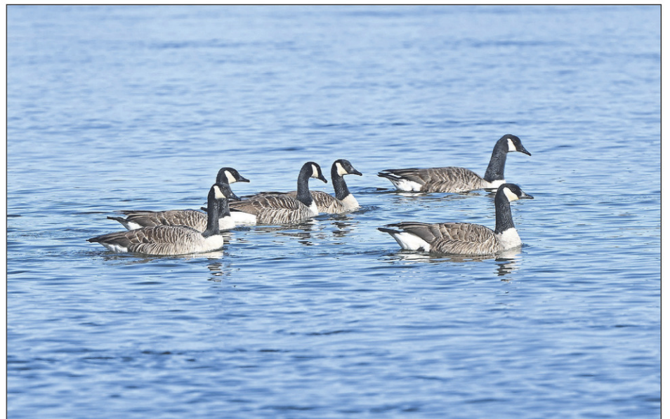
On observe aussi leur passage en automne. Elles s'arrêtent alors pour se reposer et se nourrir.