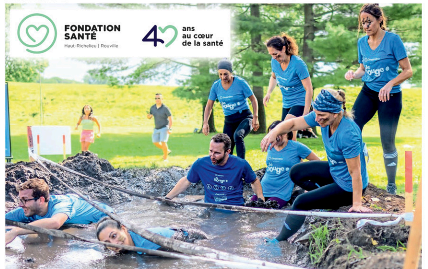
FONDATION SANTÉ Haut-Richelieu | Rouville 40 ans au cœur de la santé