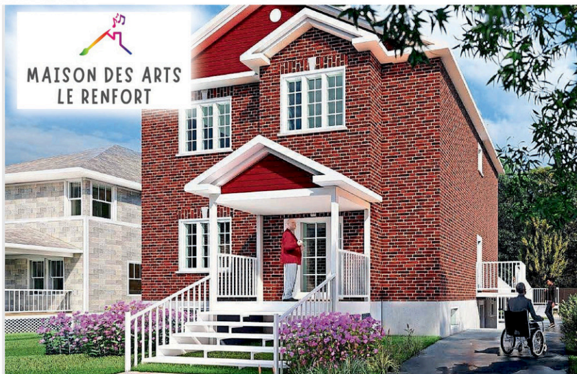
MAISON DES ARTS LE RENFORT