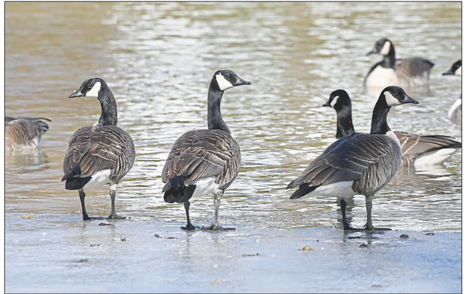
La période de migration varie quelque peu au gré des rigueurs des derniers jours de l'hiver et du dégel des cours d'eau.