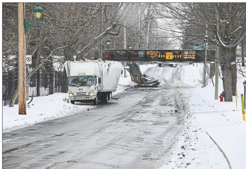
S'ils savaient voler, les camions passeraient tous au-dessus du pont des chars!

D'une part, parce que le problème, ce n'est pas la structure routière – le problème, ce sont les camionneurs. D'autre part, parce que justement, ces camionneurs sont des stars : ils peuvent attirer une attention incroyable sur votre collectivité! Alors