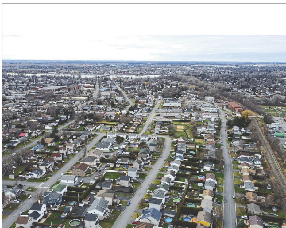
Il y a encore peu de résidences unifamiliales à vendre à Saint-Jean-sur-Richelieu. En date du 31 mars, on en dénombrait 254.

Quant au délai de vente moyen, il est en hausse. Cette année, il faut compter en moyenne 55 jours, alors que l'an dernier, les maisons se vendaient en environ 25 jours. Soulignons que l'APCIQ définit le délai de vente comme le nombre moyen de jours