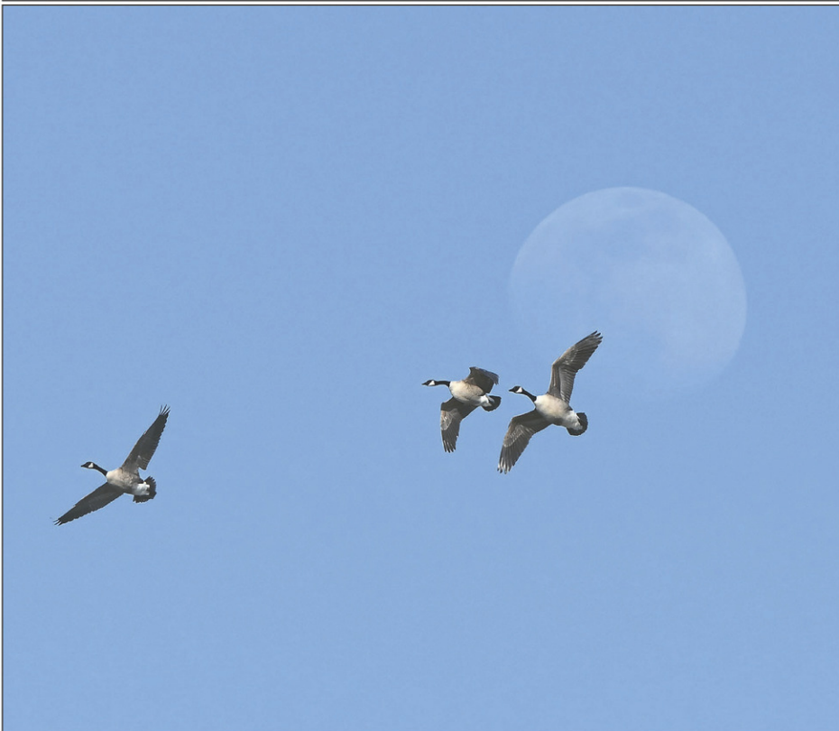
L'arrivée du printemps marque le retour des bernaches du Canada dans le Haut-Richelieu. Leur séjour sera toutefois de courte durée.