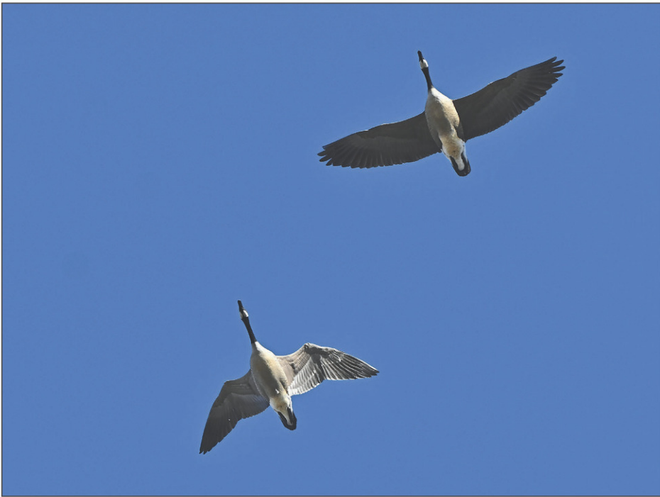
Au Québec, les bernaches du Canada sont souvent identifiées comme étant des outardes.