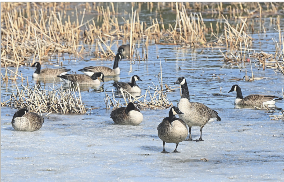
Chaque année, des milliers de bernaches passent par la région dans leur trajectoire de migration.