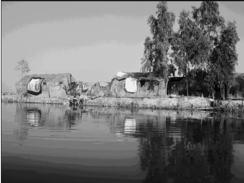
Campements de pêche à Mopti