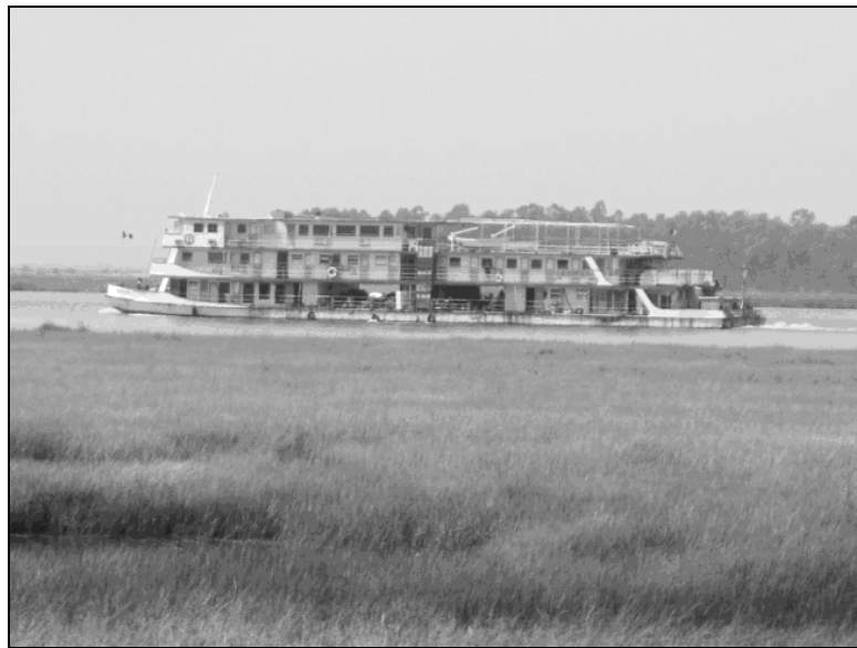
Mopti – Le bateau sur le fleuve Niger.

Ce fleuve est bondé de pirogues et de pinasses, ces pirogues à moteur. Certaines sont souvent équipées de voiles de fortune ingénieusement conçues, localement, avec des nattes ou autres tissus en coton. Mais peut-on aussi apercevoir, sur le fleuve, quelques bateaux de la compagnie malienne de navigation. Ces grands bateaux à étages relient les villes riveraines du fleuve, notamment Koulikoro, Ségou, Mopti, Niafouké, Diré, Tombouctou la mystérieuse et Gao. Au moins un des bateaux reste à quai, à Mopti, pendant la décrue, pour faire office d'hôtel flottant, et ce, au grand bonheur de nos amis touristes qui s'y louent des chambres et profitent de la fraîcheur de ses terrasses. Oui, il s'agit bien de cette fraîcheur du Delta central du Niger. Ainsi, voit-on fréquemment, sur les terrasses du bateau, des touristes prendre le frais, sans doute après une longue journée de promenade. La nuit, les terrasses et le bar sont aussi animés qu'une boîte de nuit.