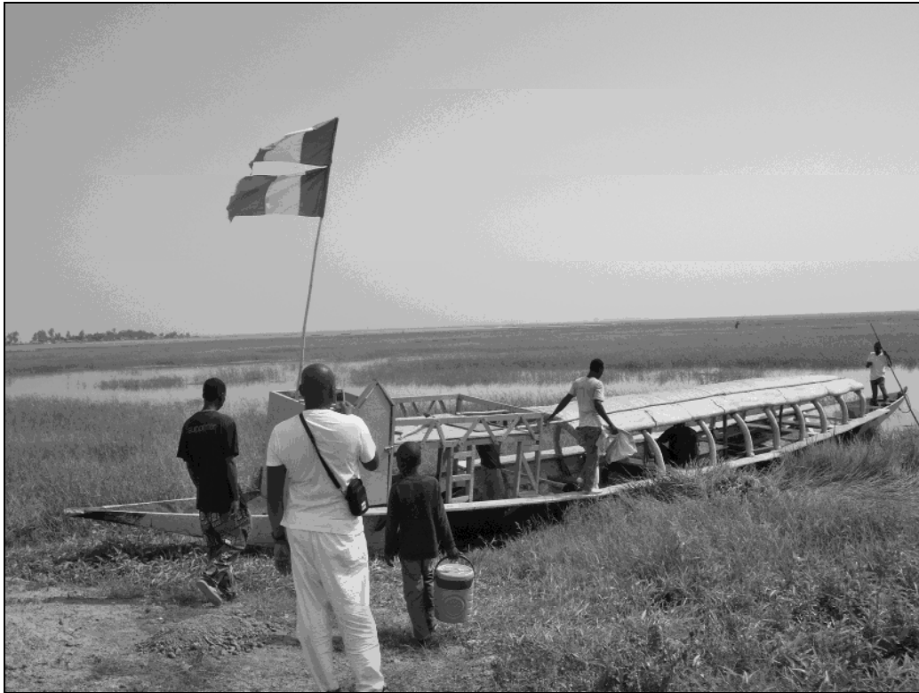
En haut: Pirogue utilisée pour les balades sur le fleuve Niger En bas: Mopti, vu du fleuve