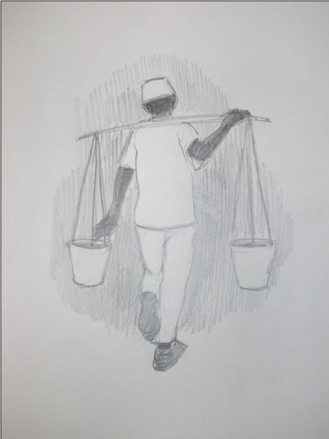
Sampana, une illustration d'Eugène Abrams.

‘Me rappelant de Sampana, le porteur d’eau, qu’il me soit permis de rappeler que le travail nous éloigne des vices, de l’oisiveté et nous permet de vivre dignement’.