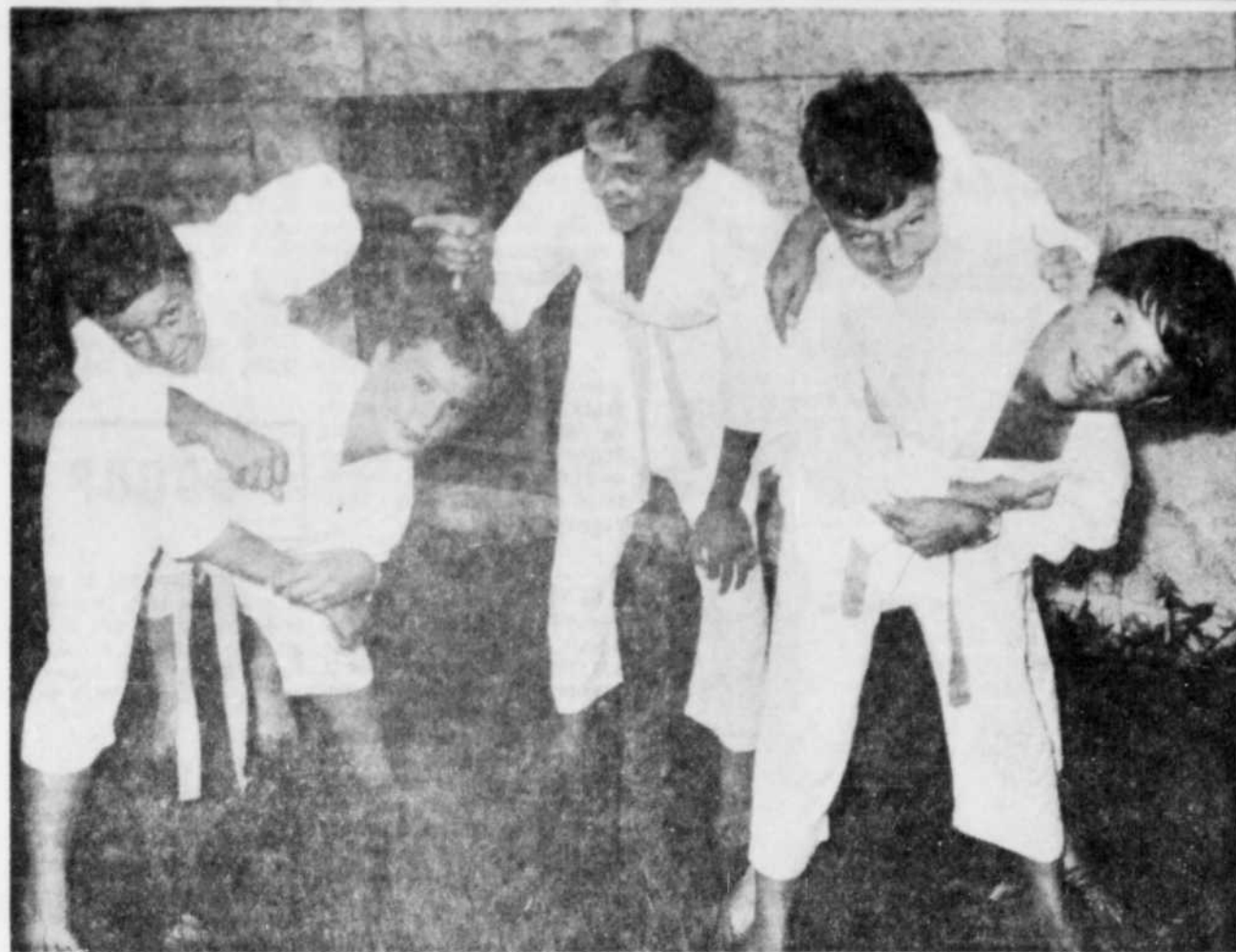
LE RAPPORT DES COMPETITIONS DE JUDO qui ont eu lieu au collège de Victoriaville entre les enfants des différents terrains de jeux de la ville démontre que c'est l'équipe Ste-Famille qui s'est classée première avec un total de 8 points. En deuxième position, on retrouve l'équipe St-David, avec 5 points, en troisième place l'équipe Assomption, avec 4 points et en quatrième, l'équipe de Marguerite Bourgeois, avec 2 points. Sur

Les examens C'est jeudi le 25 que les élèves ont pris des cours de natation au cours de l'été, passeront leurs examens de la