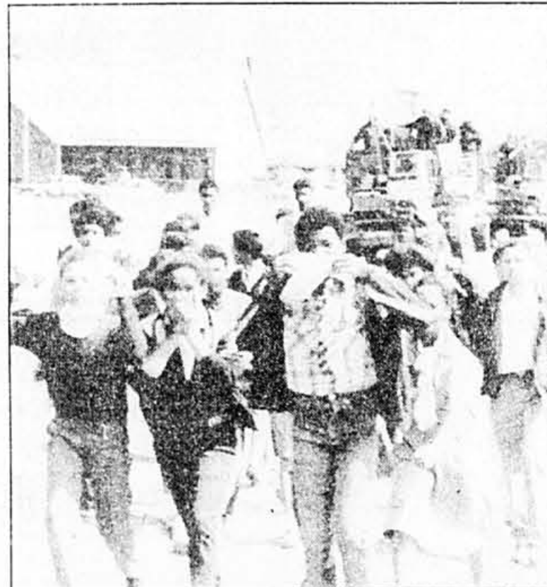
De jeunes métis fuient devant les blindés des forces de l'ordre à Landsdowne, près du Cap.

Par suite de ces changements visant à rajeunir les hauts cadres soviétiques, le BP dirigé par M. Gorbatchev comprend 12 membres ayant droit de vote et six membres suppléants.