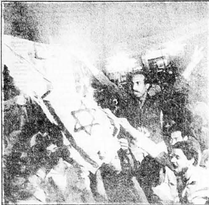
Les drapeaux américain et israélien ont été brûlés hier lors d'une manifestation des partis d'opposition au Caire en signe de protestation de l'interception par la chasse américaine d'un Boeing égyptien transportant les pirates de l'Achille Lauro.